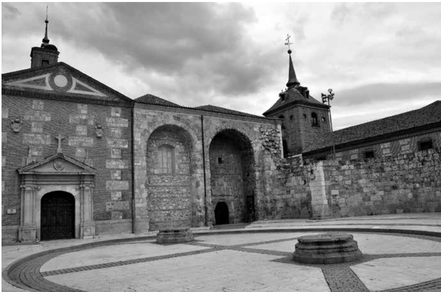
Un trocito de Alcalá.

Para seguir con la temática de este mes sobre la cultura, la lectura y el arte, nos hemos acercado a conocer algo más sobre la Capilla del Oidor. Esta capilla se encuentra ubicada al fondo de una de las plazas más importantes de Alcalá, la plaza de Cervantes, donde observaremos los restos del ábside de lo que fue la antigua parroquia de Santa María la Mayor. Es una de las parroquias más importantes creada en el siglo XIII. Además, esta capilla tiene varios datos curiosos y de reseña. Uno de ellos es que su nombre le viene por ser fundada por el «oidor» del rey Juan II de Castilla, Don Pe-