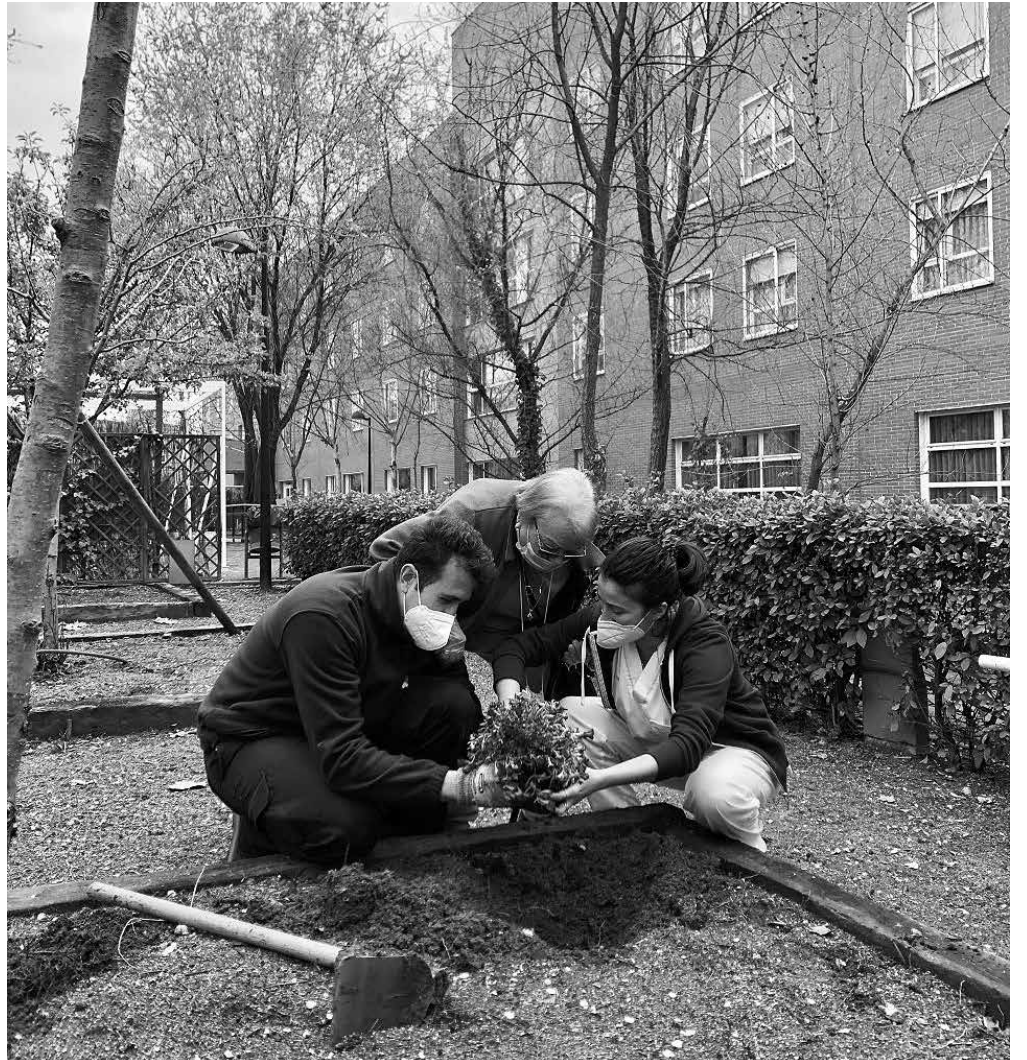
Damos forma a nuestro espacio verde.

Los jardines y espacios abiertos aportan calidad de vida e ilusión a las personas mayores. Estar en contacto con la naturaleza y disfrutar del aire libre, pasear solos o con sus familiares, tomar el sol, sentarse a observar las plantas o descansar disfrutando de un buen libro son algunos de los beneficios que tiene un espacio verde en nuestra vida. A nivel terapéutico, tener un jardín o huerto da lugar a múltiples talleres para sembrar, cuidar, regar, cosechar, etc. Estas actividades posibilitan que las personas trabajen su motricidad fina, gruesa y que participen en actividades instrumentales como la manipulación de alimentos, además de trabajar aspectos cognitivos como la memoria, la atención o aspectos emocionales a través de los momentos vividos. Para nuestra residencia era importante plasmar ese matiz personal y que lo hace especial para cada uno, por lo que se han ido creando espacios dentro del jardín donde nuestros residentes y familiares han aportado algo de ellos y que les evoca recuerdos del ayer.