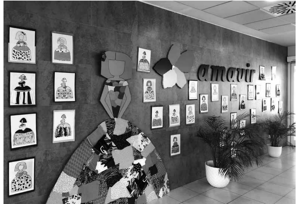
Primera edición de la exposición de cuadros de nuestros mayores.

Si hacemos una búsqueda e indagamos en la historia del porqué del Día Mundial del Arte, va más allá de dar a conocer la importancia que tiene el arte. Nos hace reflexionar sobre el pensamiento creativo, la evolución del pensamiento humano y la resolución de los problemas que nos aquejan. Nuestra parte artística nos hace ir más allá y tener una visión diferente que nos conciencia de la diversidad cultural de todos los pueblos del mundo y desempeña un rol importante en el intercambio de conocimientos y en el fomento del interés y el diálogo. El arte además engloba un conjunto de beneficios, no solo a nivel físico y cognitivo, sino también a nivel emocional, favoreciendo que se establezcan vínculos entre nosotros y creando relaciones interpersonales al compartir tiempo, inspirar y potenciar la creatividad, sanar o expresar sentimientos a través de lo que plasmamos en un papel. Desde el Departamento