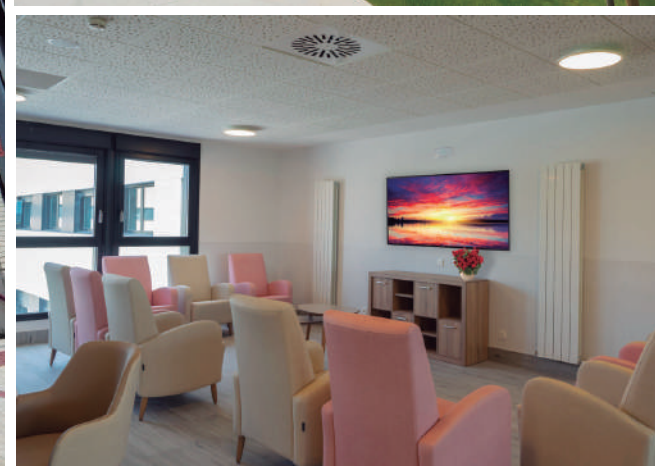
Varias fotografías del exterior e interior de Amavir Valle de Egüés.