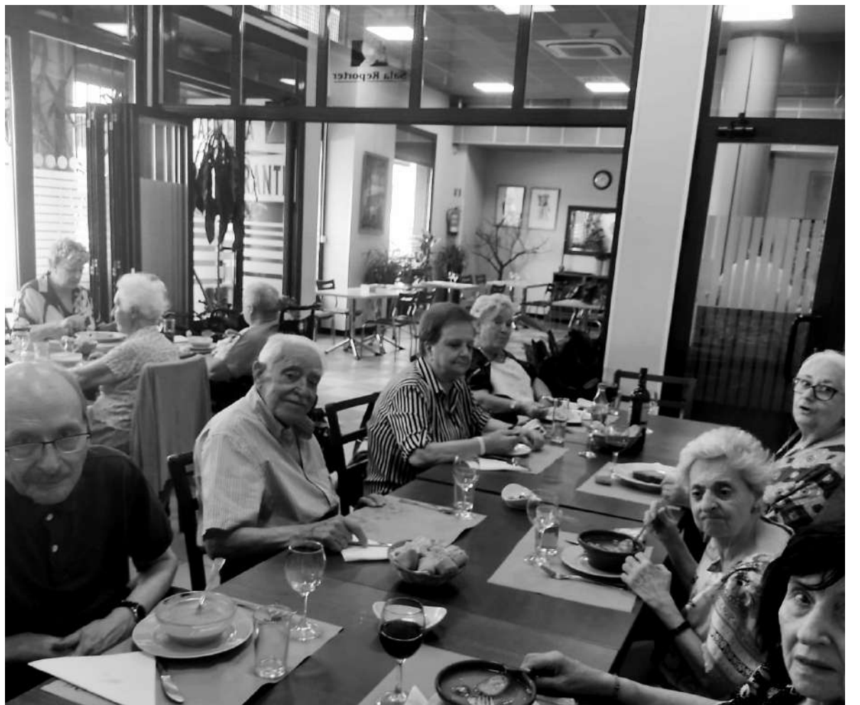
Con un salmorejo y una ensaladilla disfrutamos de las comidas fresquitas.

Con el fin de la época estival comienzan a bajar las temperaturas, los días menguantes y la climatología inestable. Por esto se suele asociar a la nostalgia y a la melancolía, dando paso a días más cortos poco a poco. Este verano hemos disfrutado de nuestros residentes dentro de las posibilidades que nos permitía esta época que estamos viviendo. Esta pandemia, con todo lo malo que conlleva, también nos aporta cosas buenas: nos hace conscientes de la importancia que tiene aprovechar cada día y ver el lado bueno de los pequeños detalles que nos regala nuestra vida cotidiana y que antes pasaban desapercibidos. Llega el otoño, y esta época nos recuerda al comienzo del colegio, cuando todo es nuevo (cursos, libros, conocimientos). Por eso asociamos esta estación al cambio, a los retos, a las novedades y a las nuevas oportunidades. Una ocasión perfecta para crear nuevos proyectos con nuestros residentes y disfrutar de las pequeñas cosas que suceden a nuestro alrededor.