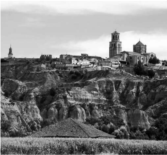
Zamora, capital de la provincia homónima y Toro, el pueblo a donde Lope se trasladó tras la muerte de su padre.