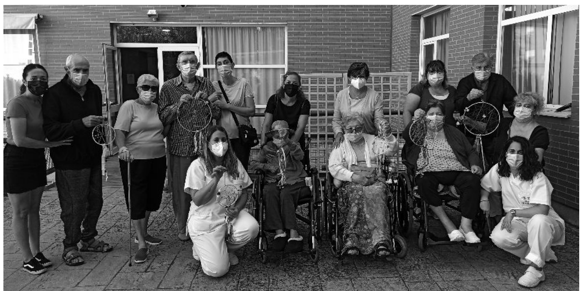
Familiares y residentes en uno de los talleres.

Durante el mes de septiembre realizamos varios talleres con las familias de los residentes y usuarios de centro de día para celebrar el Día Mundial del Alzheimer. En la actividad dejaron volar su imaginación y pusieron en práctica todo su ingenio y creatividad para llevar a cabo su atrapasueños personalizado. Estos han quedado expuestos en la residencia para que todos los podamos disfrutar. La experiencia ha sido muy buena tanto para residentes y usuarios de centro de día como para sus familiares.