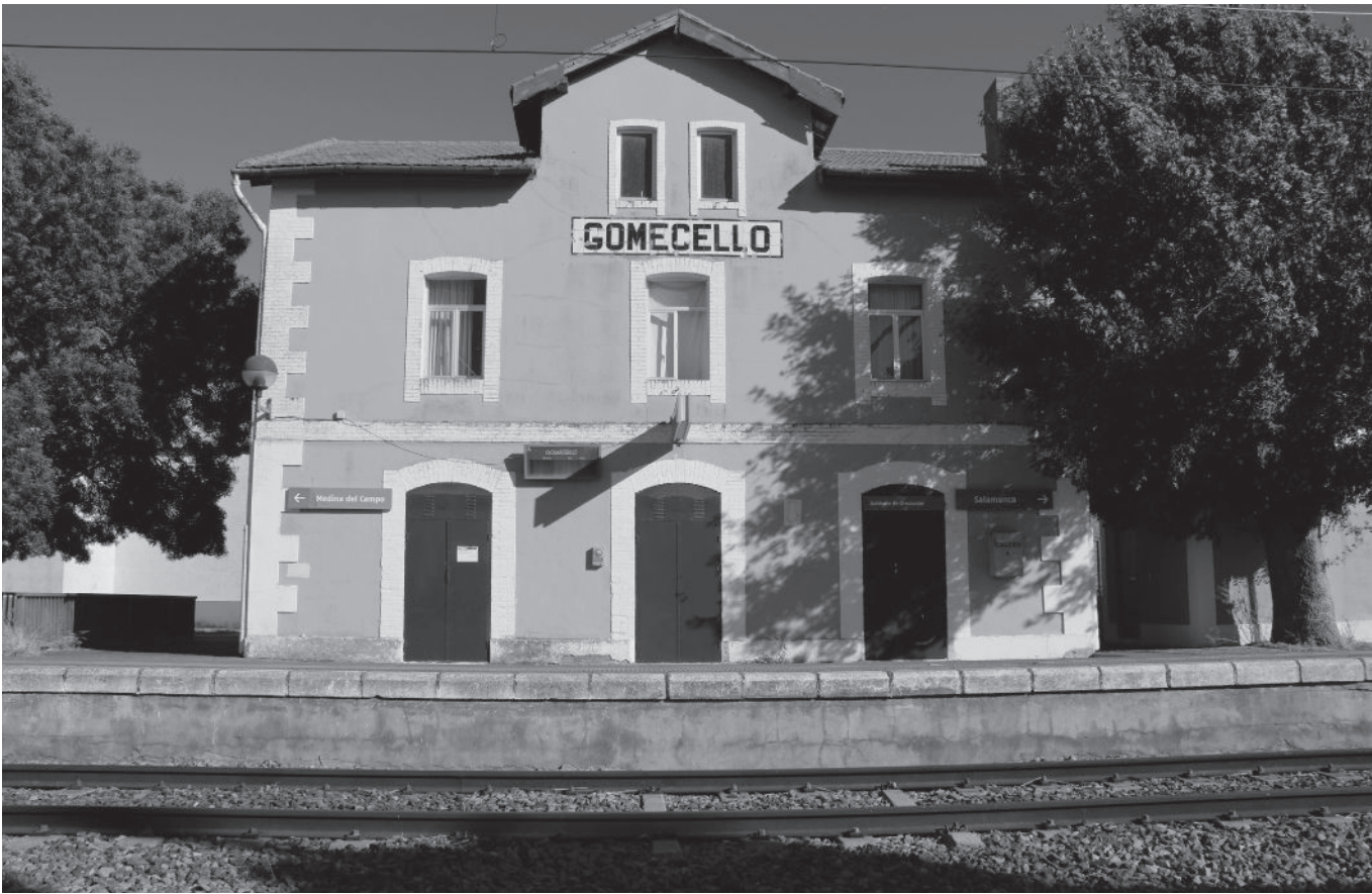
Estación de tren de Gomecello.