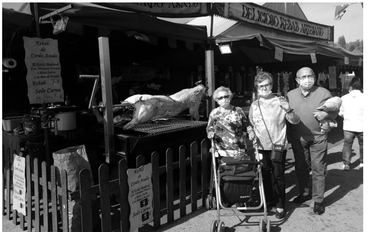
Nuestros residentes degustando productos típicos.

Desde el Departamento de Terapia Ocupacional se han llevado a cabo distintas actividades para celebrar la llegada del otoño. La más destacada, sin duda, fue nuestra tradicional visita al mercado Cervantino. Esta visita se realiza en Alcalá de Henares y nos encanta poder disfrutar de sus pasacalles, su ambiente medieval, su mercado y degustar sus productos típicos como el chorizo y el queso. Además, este año pudimos disfrutar de la compañía de nuestros amigos de Amavir Alcalá. También realizamos una visita al Parque Europa donde disfrutamos de la exposición de las Calaveras Mexicanas. Asimismo, pasamos una mañana muy divertida caminando por el parque y haciéndonos fotos con los catrines y catrinas y degustando un picoteo en otro ambiente al que acostumbramos. Y, por último, también se realizó un bingo típico de otoño donde pudimos repartir premios con la temática de Halloween.