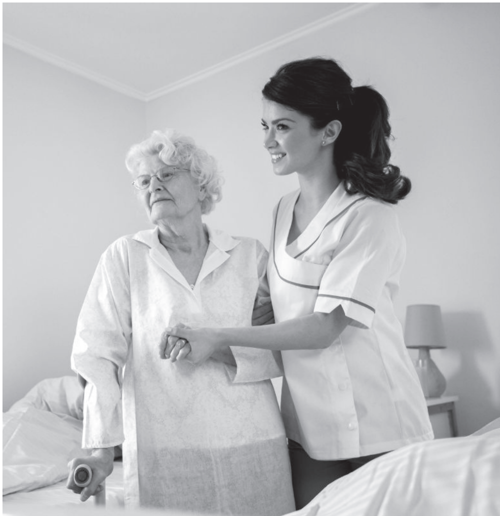
Una profesional de cuidados auxiliares acompañando a una persona mayor.

El día 5 de noviembre se celebra el Día Internacional del Cuidador, un reconocimiento muy merecido para aquellas personas que se dedican de manera profesional o, como apoyo familiar, al cuidado de personas mayores o en situación de dependencia. Los cuidadores constituyen un recurso de gran valor, ya sea los que lo hacen de manera profesional o los que cuidan de los demás fuera de su entorno laboral, pero a la vez son muy vulnerables, ya que tienen una gran carga física, psíquica y emocional. En muchas ocasiones estos profesionales se descuidan y se olvidan de mirarse a ellos mismos, esto suele suceder sobre todo en el ámbito familiar. Por esta razón, es importante que los cuidadores puedan identificar y atender sus propias necesidades, para así afrontar con fortaleza emocional las dificultades diarias que surgen de esta tarea. De igual manera, es fundamental dar visibilidad a esta figura. Desde hace 5 años, gracias a la Sociedad de Geriatría y Gerontología se reconoce a todas estas personas celebrando el Día Internacional del Cuidador. Nosotros desde Amavir San Agustín nos unimos a este agradecimiento a todas las personas que se dedican a velar por los demás, una labor muy importante y en muchas ocasiones poco reconocida. ¡Gracias a todos los que cuidáis!