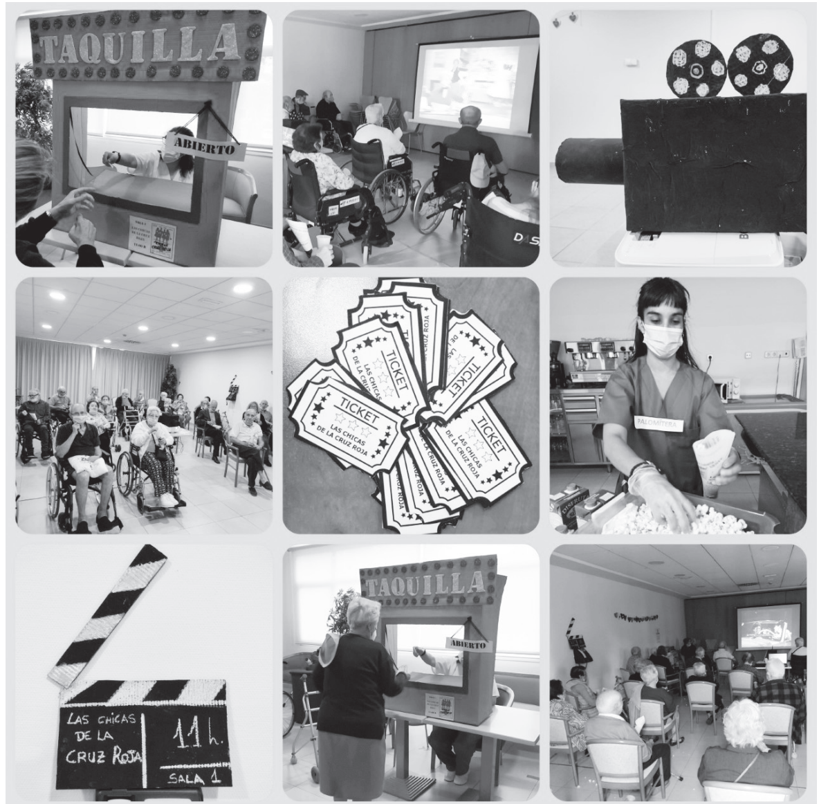
Imágenes de la divertida sesión de cine.

El mundo celebró el Día Internacional de las Personas Mayores el pasado 1 de octubre. Un evento que, este año más que nunca, ha prestado especial atención a este colectivo. Es un día perfecto para resaltar la importancia de su contribución a nuestra sociedad. Todos ellos dejan una huella que es imposible de olvidar. Todas sus experiencias son un tesoro que nos enriquece cada día. La población de personas mayores está creciendo, al igual que crecen sus necesidades. Tanto en este día, como en el resto, debemos concienciar sobre los problemas y retos que plantea el envejecimiento en el mundo actual. Desde nuestra residencia, festejamos este día, realizando una sesión especial de cine ambientado en la época de nuestros usuarios, con acomodadoras y taquillera, palomitas y bebidas. Todo decorado para la ocasión, gracias al trabajo de residentes y usuarios del centro de día, quienes con diversos materiales consiguieron un cine de antaño. Todos los días son una oportunidad para crecer y compartir entre generaciones. Nuestros héroes no tienen capa, pero sí sabiduría y experiencia, son nuestros mayores.