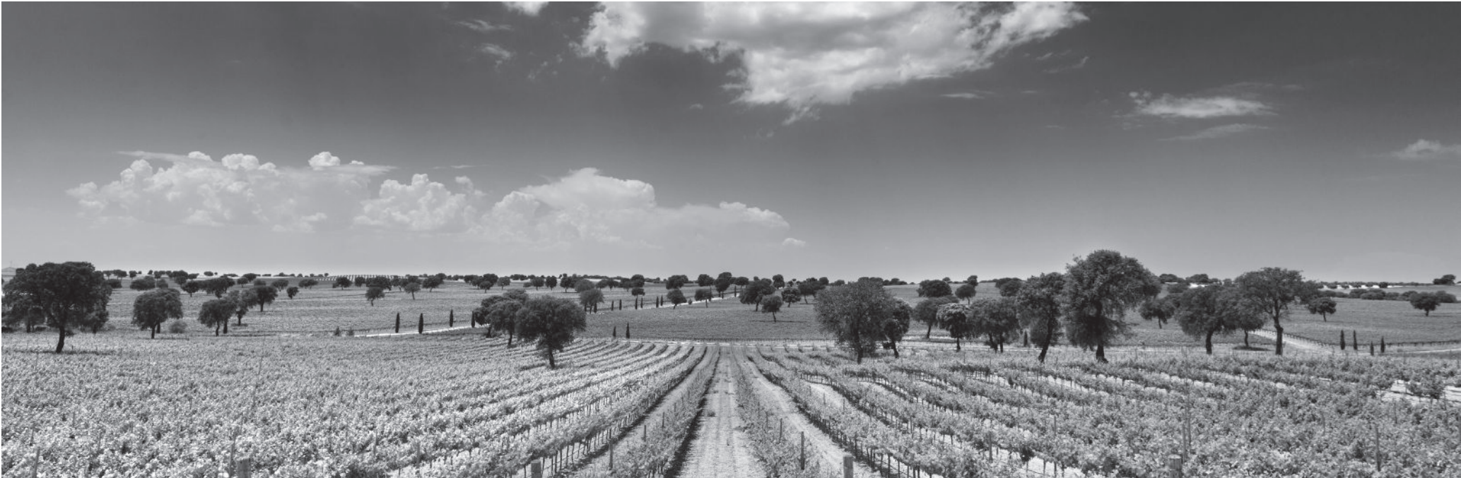
Imagen de los viñedos de Corral de Almaguer.