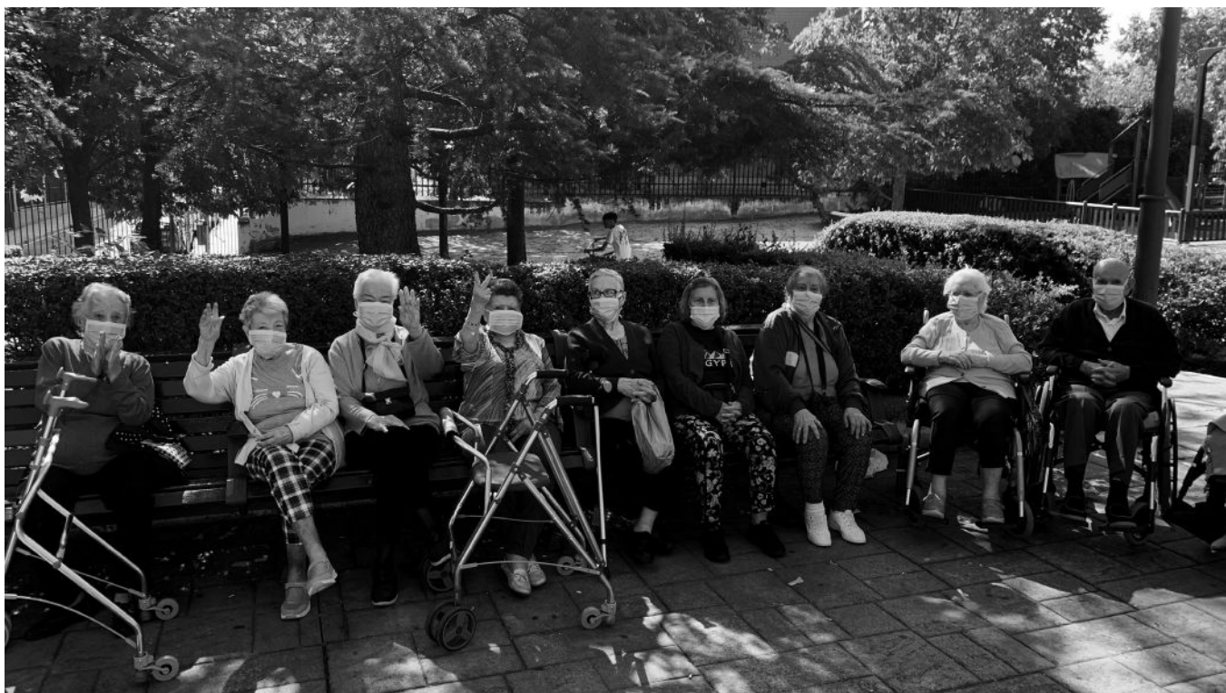
Encuentro en el parque.

Tras estos meses de parón con motivo de la pandemia, por fin hemos comenzado a retomar las actividades en nuestra residencia. Gracias al nuevo protocolo, podemos poco a poco ir volviendo a la normalidad, algo que nuestros residentes necesitan, tanto a nivel físico, social, como emocional. Durante la crisis sanitaria se ha visto reducida su actividad física, provocando problemas de sueño, insomnio y somnolencia diurna. Asimismo, han tenido un aumento del deterioro cognitivo por haber dejado de realizar actividades de estimulación cognitiva, talleres, afectación del estado emocional y anímico, con un aumento de la sintomatología depresiva a falta de contacto con red social y soledad. Por eso, aprovechamos la mañana para disfrutar de un maravilloso paseo hasta el Parque de las Esculturas donde disfrutamos de una estupenda mañana al aire libre. Retomamos también las fiestas de cumpleaños, que realizamos los últimos