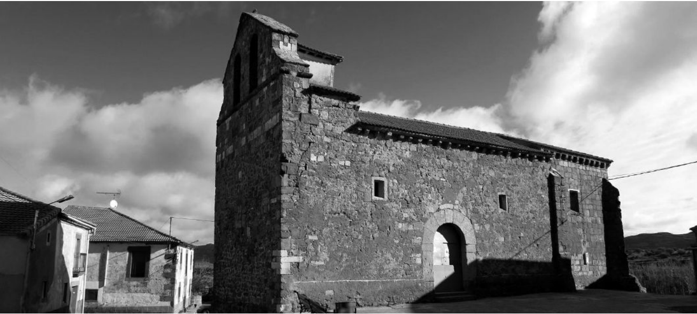
Iglesia de Losana.