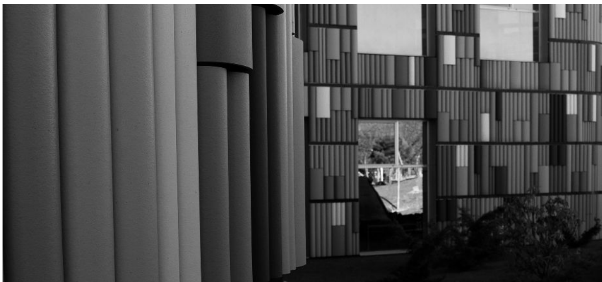
Biblioteca Central de Leganés.

Hemos retomado la colaboración con la biblioteca de Leganés. Se han realizado numerosas visitas a sus charlas organizadas, y también se han trasladado a nuestro centro para facilitar la mayor asistencia y participación de nuestros mayores. Durante este tiempo hemos disfrutado de una programación especial en la que se han propuesto actos culturales relacionados con la lectura dentro de un ambiente distendido y lúdico, a través de vídeos, audios y la participación activa de todos los asistentes comentando sus vivencias personales. Estamos muy agradecidos por esta colaboración, ya que nuestros mayores disfrutaban y se enriquecen con la actividad.