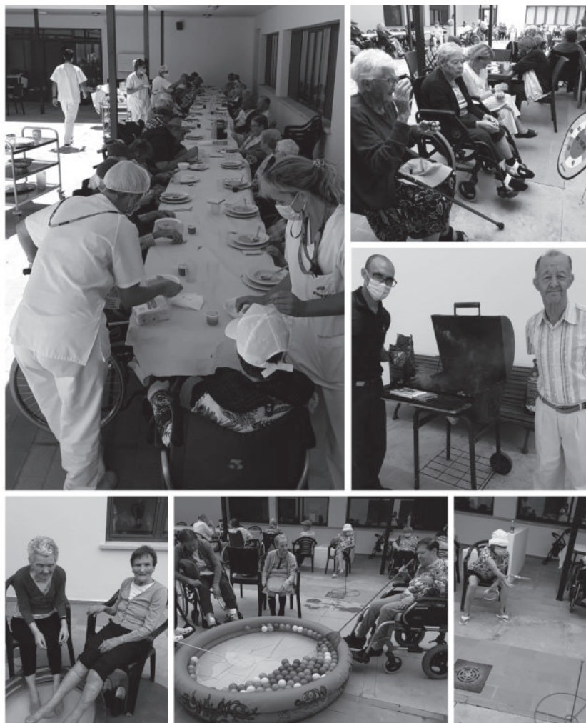
Residentes, usuarios de día y trabajadores disfrutando de la fiesta de la barbacoa.

Durante el verano afloran las ganas de disfrutar del buen tiempo al aire libre y en la mejor compañía, razón por la cual celebramos una fiesta en el patio del centro donde la parrilla y el carbón fueron los principales protagonistas. Residentes, usuarios y usuarias del centro de día y trabajadores y trabajadoras pudimos compartir la experiencia de disfrutar de una rica barbacoa en familia. ¡Y no solo eso! Nuestros mayores también pudieron participar en una divertida gincana: pesca de bolas, lanzamiento de aros, diana de pelotas, petanca, derribo de bolos y muchos otros juegos que hicieron que disfrutáramos aún más, si cabe, del encuentro. Tampoco pudimos dejar pasar la oportunidad de sacar nuestras piscinas hinchables y es que, como es habitual, hubo quien decidió remojarse los pies para mantenerse bien fresquito, pues ya sabemos que cuando el sol aprieta... Así fue como residentes y trabajadores entre bailes, juegos y sonrisas convertimos una tarde cualquiera en un día para recordar en Amavir Haría.