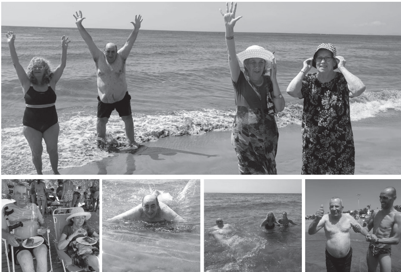
Residentes y trabajadores en la playa de Puerto del Carmen.

El pasado 26 de agosto preparamos nuestros sombreros y bañadores para irnos a la preciosa playa de Puerto del Carmen. Allí nos esperaban con ilusión los residentes de Amavir Tías y algunos familiares con quienes pasamos una jornada espectacular. También nos acompañó el buen tiempo para remojarnos los pies andando por la orilla o, incluso, para darnos un chapuzón. Para rematar el día, disfrutamos en conjunto de un pícnic completo compuesto de tortilla, empanadillas y paella, ¡toda una delicia! En definitiva, pasamos un día espléndido que no dudamos en volver a repetir.