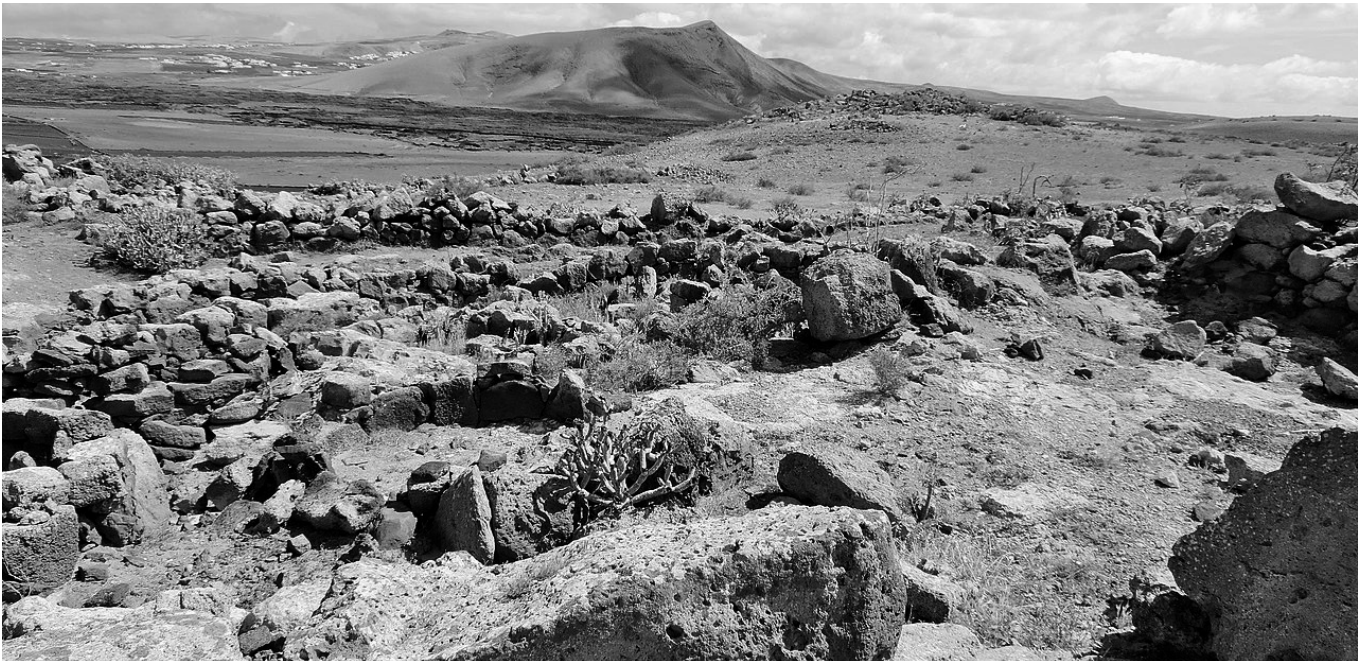
Zona de Zonzamas en Lanzarote.