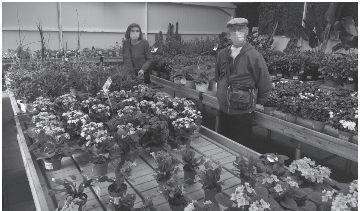
Algunos residentes en el vivero Projardín.

Tras casi dos años sin poder hacer excursiones al exterior con los residentes debido a la COVID-19, poco a poco volvemos a la normalidad. En esta ocasión se han retomado las salidas con mucha ilusión y con más ganas de que todo vuelva a la normalidad. En concreto, hemos comenzado a realizar excursiones al vivero Projardín de Alcorcón, para comprar plantas tanto para los residentes como para la realización de Jardines Eternos: un nuevo proyecto del Departamento de Animación con el que se pretende decorar sus habitaciones y el centro.