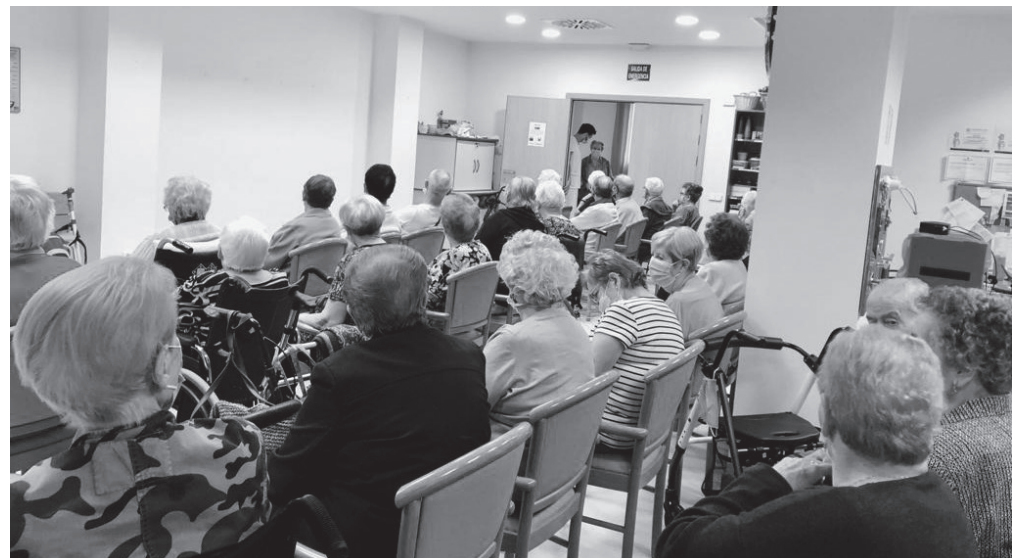
Colgamos el cartel de aforo completo en la sala de Terapia Ocupacional.

La Asamblea General de las Naciones Unidas designó el 1 de octubre para conmemorar el Día Internacional de las Personas de Edad. En Amavir Alcalá, como no podía ser de otra forma, nos sumamos a esta celebración en un día tan significativo para nuestros mayores como es esta fecha. De esta manera, festejamos en nuestra casa una actividad muy especial por su día y les reunimos en la sala de Terapia Ocupacional para realizar un viaje en el tiempo todos juntos. Preparamos una presentación con objetos y escenas de antaño visualizando en imágenes cómo eran en el pasado los medios de transporte, los muebles, los objetos de uso cotidiano y las bodas de antes. Junto a nuestros mayores, nos adentramos en sus recuerdos y testimonios de manera interactiva. Recorrimos entre todos ese océano de emociones que supone trasladarnos “a la vida de antes”. Compartieron por turnos sus anécdotas y recuerdos de los distintos objetos y escenas que proyectábamos en las imágenes y disfrutaron mu-