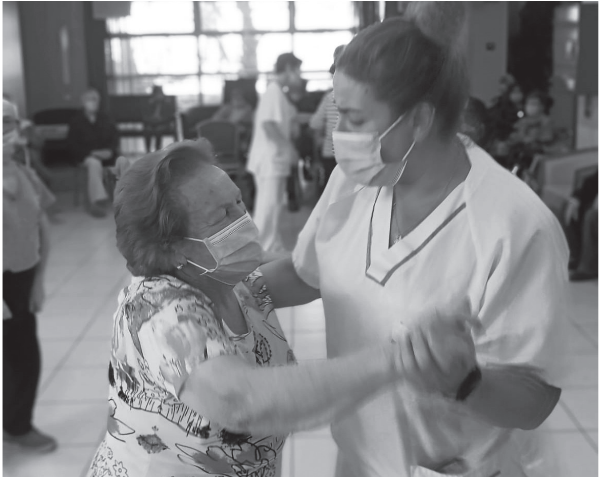
Nuestros residentes se lo pasaron en grande durante la jornada de celebración de cumpleaños.

Os anunciamos, con gran entusiasmo, que en Amavir Alcalá volvemos a reunirnos residentes, trabajadores y familiares en eventos tan importantes como los cumpleaños de nuestros mayores. Cada fiesta se prepara con mucho cariño y mimo. La residencia se llena de música típica de su época, danzan en parejas, en grupos, sacan a bailar a los que necesitan apoyo de nuestros trabajadores... En definitiva, se transportan a ese recuerdo de su juventud, ya que nuestros residentes han sido y son todos unos bailarines. Antes de acabar con la celebración, dedicamos un espacio para nombrar y aplaudir a cada uno de los protagonistas, cantándoles como broche de oro el gran esperado cumpleaños feliz. Nuestros mayores disfrutaron de una jornada donde la música, el baile y la alegría fueron los protagonistas indiscutibles del día.