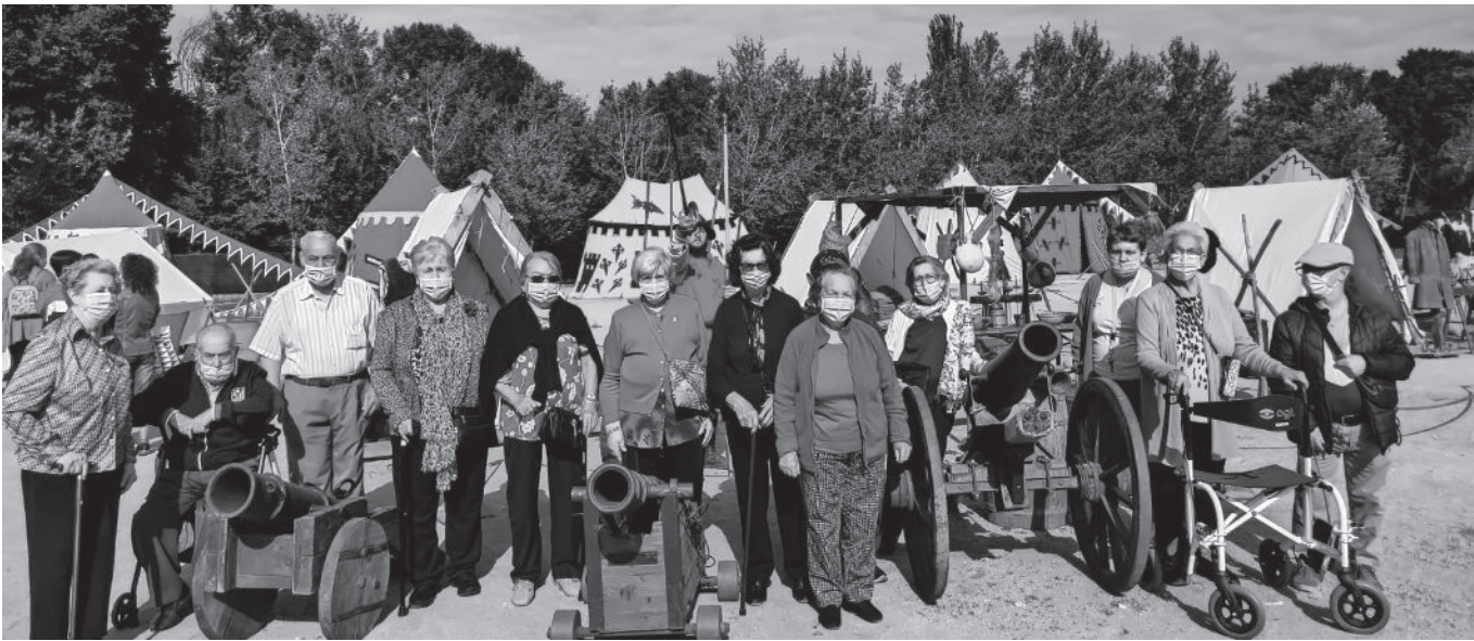
Nuestros mayores durante la excursión al mercado de este año.

El mercado medieval de Alcalá de Henares realmente se llama Mercado Cervantino, y es el más grande de España y de Europa. El sábado 9 de octubre es la fecha en la que se conmemora el bautismo de Miguel de Cervantes y este día se celebra la procesión cívica con su partida de bautismo que, después, el público podrá ver en la Capilla del Oidor. Se hace coincidir esta fecha tan significativa con la edición anual del mercado cervantino, que rinde homenaje a la figura del ilustre escritor Miguel de Cervantes. Durante cinco días, la ciudad del Quijote se transforma y se llena de magia, haciéndonos