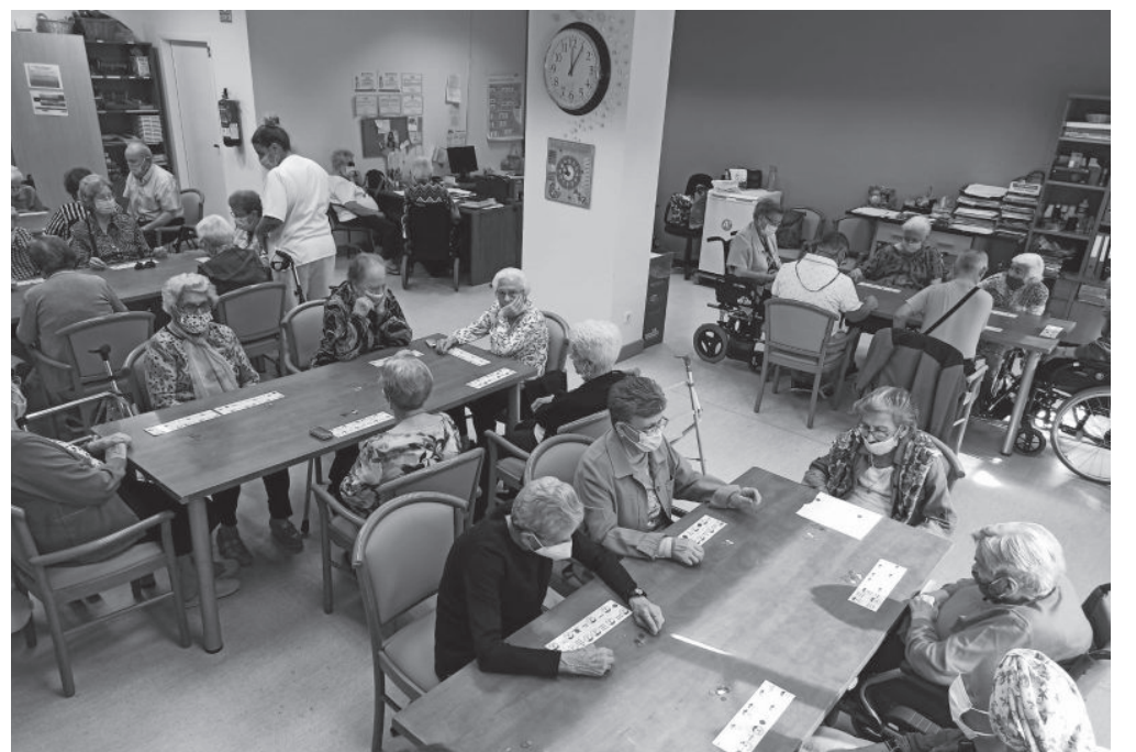
Nuestros mayores durante el bingo musical.

En el Día Mundial del Alzheimer disfrutamos de una jornada de música, esa gran aliada que siempre nos ayuda a evocar recuerdos, vivencias y emociones. A su vez, nos acerca al entorno donde vivimos y a las personas con las que convivimos en nuestro día a día. Desde el Departamento de Terapia Ocupacional creamos un bingo adaptado a las necesidades de cada uno de nuestros residentes junto con una selección de temas que configuraba lo que sería “la banda sonora de su vida”. Esta actividad no solo fue un momento significativo para los residentes, sino que, adivinar las canciones se convirtió en una tarea motivacional, animándose a cantar a pleno pulmón a incluso a bailar “La Macarena”.