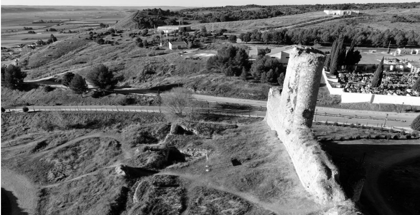
El Castillo de Fuentidueña.

Fuentidueña es un municipio de España ubicado en la provincia de Segovia, comunidad autónoma de Castilla y León. Cuenta con alrededor de 100 habitantes. En 2007 buena parte de la ciudad fue declarada Conjunto Histórico. Algunos de los monumentos más importantes son: el Castillo de Fuentidueña, la Iglesia de San Martín, la iglesia de San