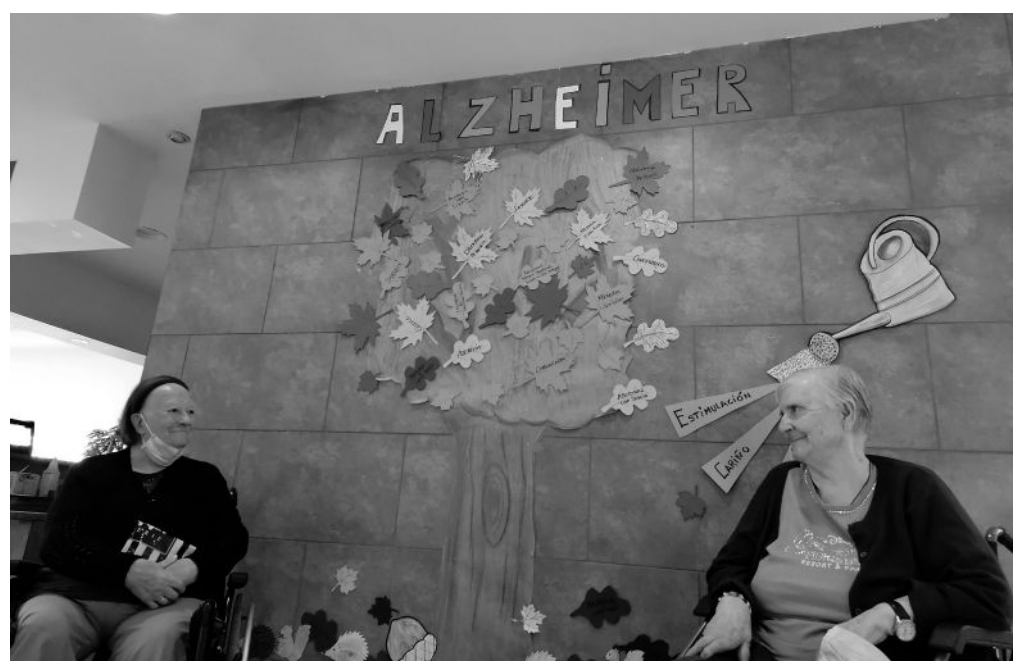
Actividades realizadas por nuestros residentes y usuarios de Amavir Villaverde.

El 21 de septiembre se celebró el Día Mundial del Alzheimer. A lo largo de la semana creamos un árbol con los residentes en el que las hojas simbolizaban aquellas capacidades que se pueden ir perdiendo con la enfermedad, lo que podemos aportar desde la familia y los profesionales necesarios para mantener estas habilidades el mayor tiempo posible. En el centro de día tenemos un árbol con fotografías de ayer y hoy en el que nuestros usuarios se reconocen. Esto les ayuda a cohesionar el grupo, así como a trabajar los recuerdos. Para celebrar el 1 de octubre, el Día Internacional de las Personas de Edad, confeccionamos entre familiares, residentes y trabajadores un bonito vídeo en el que pusimos en valor todo aquello que ganamos con la edad.