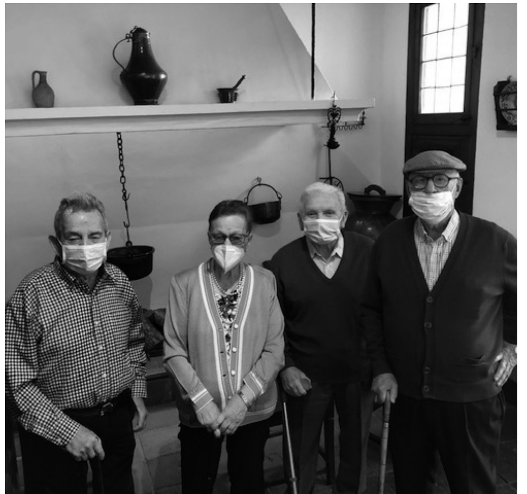
Nuestros residentes en la visita al museo Lope de Vega.

El pasado 14 de octubre un grupo de residentes pudo visitar la Casa Museo Lope de Vega. Un guía muy agradable nos estuvo explicando dónde vivió don Lope, dónde descansaba, escribía o recibía a amigos. Asimismo, nos mostraron todas las dependencias de la casa. Entre ellas nos llamó la atención el patio interior que está compuesto por un corral y diversas plantas: un granado y una parra entre otros, ya que al escritor le gustaba mucho el huerto. Vivió en la casa 25 años de su vida. Era muy creyente y en esta tenía una capilla en homenaje a San Isidro Labrador. En la casa había varias escaleras, lo que hizo que redujésemos el grupo de visita. Para aquellos residentes que no pudieron visitar el museo por temas de movilidad, nos han ofrecido venir a nuestro centro el 4 de enero para que todos podamos conocer la casa de Lope de Vega desde nuestro propio hogar con apoyo audiovisual y un orador que nos explicará todas las anécdotas y curiosidades del lugar. En la visita nos contaron múltiples historias de la época, como que la cocina era muy antigua con el caldero y la lumbre. El tiempo acompañó y pudimos disfrutar de la salida, viendo en el recorrido la zona centro de Madrid. Esta es una primera excursión de muchas más que vamos a poder realizar, ya que las restricciones en cuanto a la pandemia son menos estrictas gracias a que las campañas de vacunación están funcionando muy bien en nuestro país.