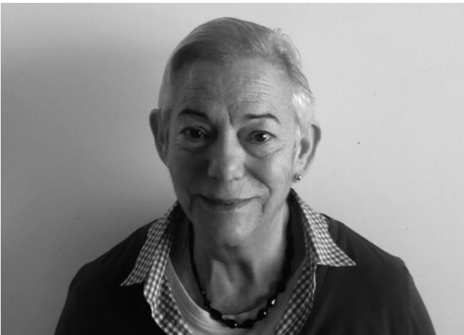
M.ª Sol trabajó con el gran Karlos Arguiñano.