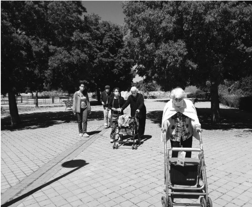
Algunos de los residentes disfrutando del sol.

Echábamos de menos las salidas por el barrio y disfrutar de las mañanas, del aire que mueve las hojas de los árboles viendo cómo caen a nuestro paso y las conversaciones mientras atravesamos nuestro Parque de Valdebernardo. También nos gusta saborear el aperitivo y un buen vermú en buena compañía, compartiendo experiencias y recuerdos de antaño, afianzando amistades y formando otras para crear memorias conjuntas. Dábamos paseos que dibujan sonrisas, esas que nos alegran el corazón y que nos iluminan la mirada. Con estas salidas conseguimos esbozar sonrisas que valen mucho más después de estos últimos años. Estas escapadas de ocio que estábamos deseando retomar, y que nos encanta compartir con nuestros mayores. Momentos únicos con ellos que deseamos seguir viviendo en familia.