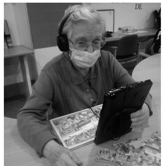
¡Qué buen invento!

do a las medidas de prevención establecidas, el equipo de profesionales del centro tiene también entre sus prioridades mantener su bienestar emocional, algo fundamental en periodos de aislamiento como el que vivimos. A través de la realización de este tipo de llamadas, ayudamos a los residentes a combatir la soledad y el aislamiento social, les sirve de desahogo y logran sobrellevar la incertidumbre reduciendo también sus niveles de estrés.