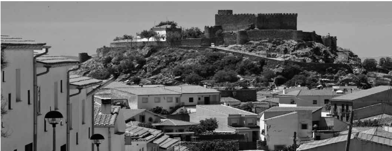
Montánchez, un lugar con encanto.