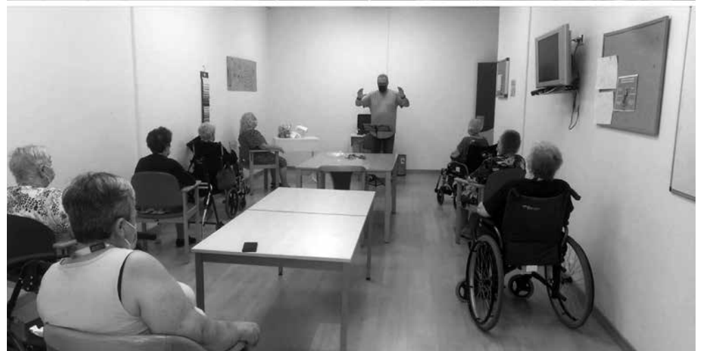
Momentos del último concierto y de una sesión de nuestro coro de Usera.