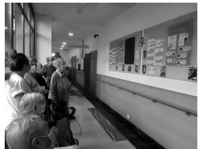
Actividad realizada en homenaje a las personas que padecen Alzheimer.

problemas con la memoria, el pensamiento y el comportamiento. Los síntomas empeoran con el tiempo, afectando las tareas cotidianas. En esta iniciativa pudimos conocer cuáles son las primeras señales de la enfermedad, ciertas acciones que podemos hacer en nuestro día a día para tratar de frenar el deterioro cognitivo o cuáles son los beneficios de las terapias de estimulación sensorial en casos más avanzados. En el taller aprendimos cómo debemos comportarnos con una persona que padece Alzheimer y, por último, disfrutamos de un bello poema.