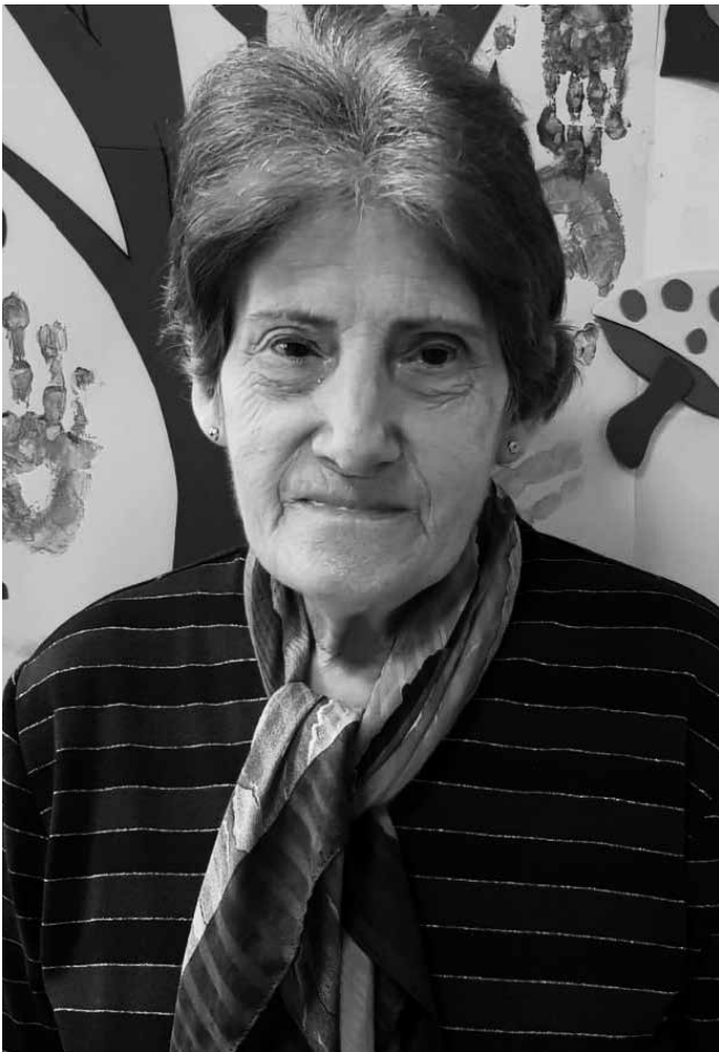
Nuestra experta paellera.

Mientras pongo la paellera en la lumbre, voy calentando el horno. En la paellera frío el pollo y el conejo. Aparte, pelo las gambas y cuezo las cáscaras para aprovechar el jugo. Echo el arroz en la paellera junto con la carne y añado el agua y el caldo de marisco. Cuando empieza a cocer lo meto al horno. Media hora después, ¡listo para comer! Y, ¡rico, rico! “¿La paella? Mucho mejor al horno. Se hace de lujo”.