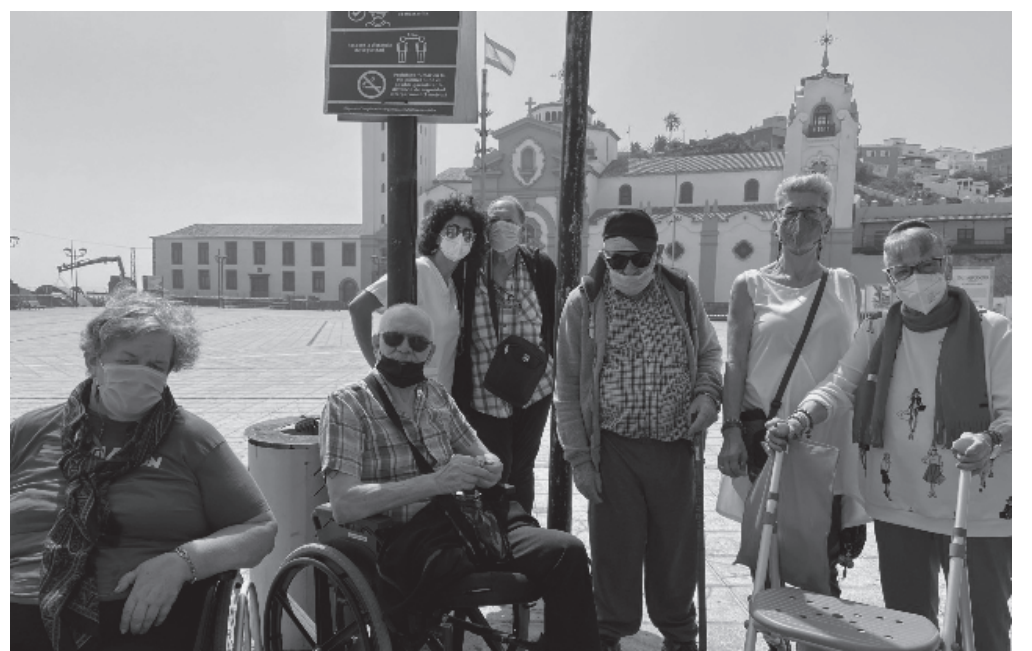
Residentes en la plaza de la Candelaria.

Para conmemorar el 1 de octubre, Día Internacional de las Personas de Edad, un grupo de residentes visitó la Villa Mariana de Candelaria, un lugar muy agradable para pasear por su cercanía al mar y por los comercios que se encuentran en la zona. Además, pudieron ir a conocer a la Patrona de Canarias, la Virgen de la Candelaria, una basílica declarada como Bien de Interés Cultural. Los participantes disfrutaron de una mañana muy soleada, por lo que aprovecharon para tomar un pequeño aperitivo en una de las terrazas que se encuentran allí. Con este tipo de actividad se favorecen las relaciones interpersonales y la comunicación entre los residentes, además de mejorar la autoestima y el estado psicofísico.