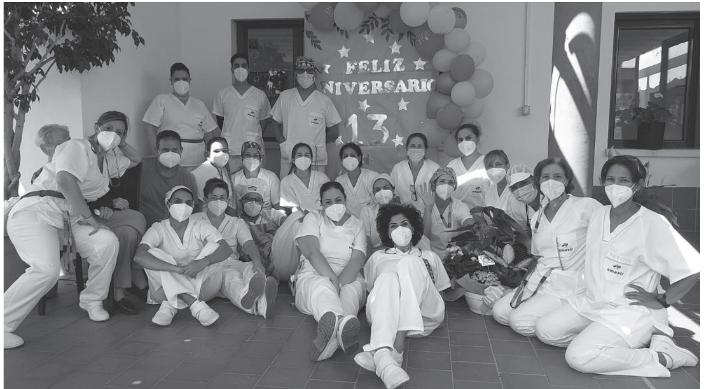
Trabajadores celebrando el 13º aniversario del centro.

En el mes de septiembre, Amavir Tejina celebró su 13º aniversario, donde residentes y trabajadores disfrutaron de actividades y celebraciones por todo lo alto. Toda celebración tiene su propia programación, por ello, se elaboró un cronograma de actividades especiales para que nuestros residentes pudieran festejar de una manera divertida y entretenida el cumpleaños de nuestro centro. Uno de los juegos más señalados fueron las gerolimpiadas que organiza el Departamento de Fisioterapia. En este, los participantes realizaron pruebas de fuerza, coordinación, equilibrio y flexibilidad. Con toda su energía, los participantes demostraron sus capacidades y destrezas para llegar a la meta. Toda celebración tiene su fiesta y,