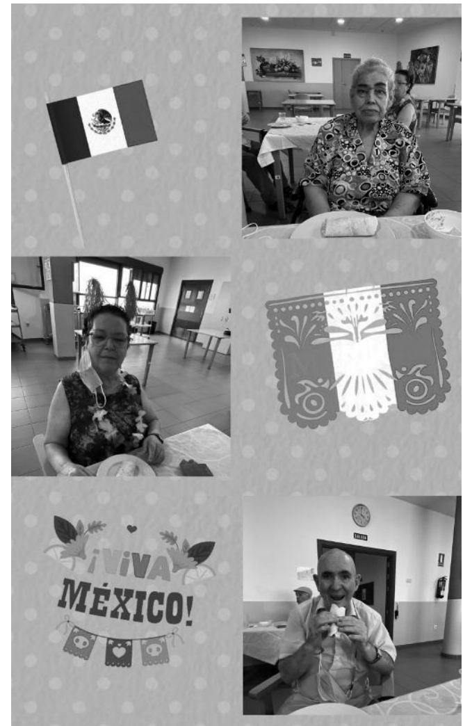
Taller “Sabores del Mundo”, conociendo México.

culinario encierra para ellos un significado personal del que podemos expresar un beneficio. “Sabores del Mundo” forma parte de ese elenco de pequeñas cosas cotidianas que van conformando nuestras historias mínimas, porque las comidas que elaboramos o los alimentos que ingerimos son hechos claves de ese rompecabezas que supone nuestra vida personal. Nos describen y tienen una poderosa conexión con nuestro mundo emocional. En estos meses anteriores hemos viajado a Nueva York con los hot dogs, a México con los nachos con guacamole y las fajitas, a Venezuela con las arepas, y a Francia con las crepes. Esperamos dar la vuelta al mundo y conocer nuevos sabores en los próximos meses.