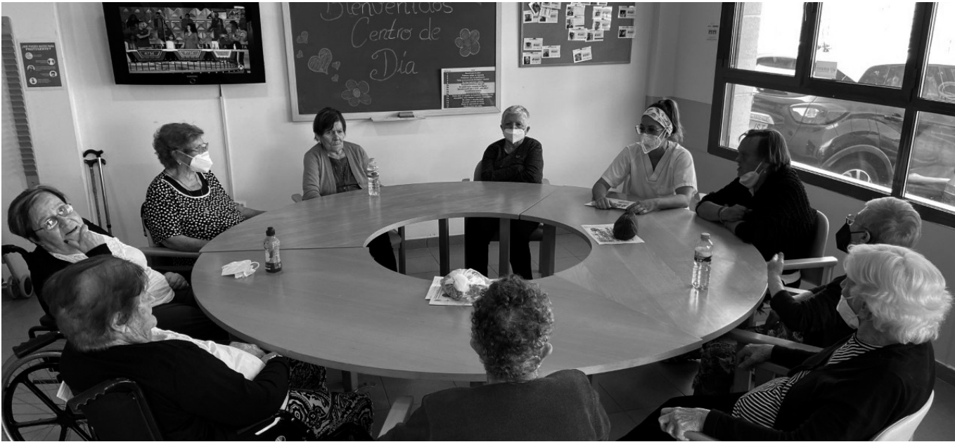
El grupo de usuarias del centro de día.

Tejina es una entidad de población perteneciente al municipio de San Cristóbal de La Laguna, en la isla de Tenerife. Junto con Valle de Guerra, Bajamar y Punta del Hidalgo constituye una pequeña comarca. El pueblo de Tejina cuenta con una larga costa, donde podemos encontrar grandes rincones escondidos y lugares con mucha historia. Varias usuarias del centro de día recuerdan historias y hablan de diferentes zonas que se encuentran escondidas y, hoy en día, los jóvenes ni las conocen ni las visitan. Recuerdan el charco de La Lajas, un lugar de baño que solo podían visitar