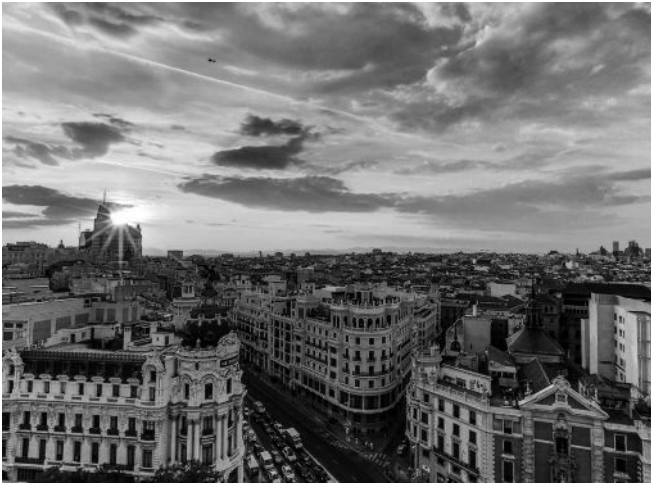
Vista panorámica de Madrid y Pozuelo de Alarcón.