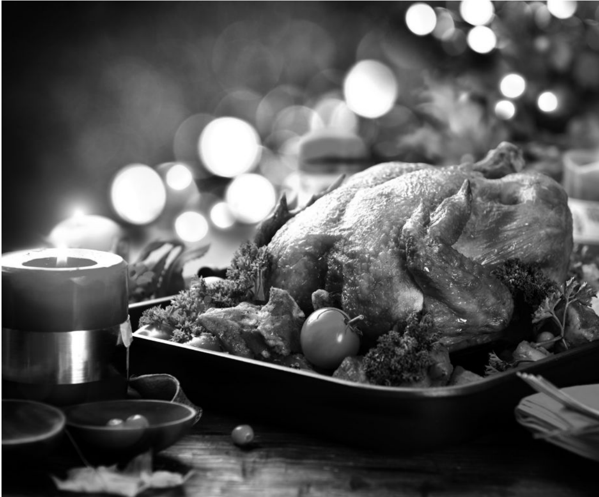
Disfrutemos de estas Navidades.

Se acerca la Navidad y, como siempre, en Amavir Pozuelo preparamos estas fiestas tan entrañables con la mayor ilusión, este año más si cabe, ya que poco a poco volvemos a la esperada normalidad. Tendremos nuestro teatro navideño donde los residentes disfrutan participando en él. Algo que también les encanta es la salida a ver los Belenes y, cómo no, la visita de Sus Majestades Los Reyes Magos, Melchor, Gaspar y Baltasar que vienen de Oriente a repartir regalos y mucha ilusión a cada uno de nuestros residentes. Contaremos con un menú especial para celebrar estas fiestas como se merecen, brindaremos para que el Año Nuevo llegue cargado de alegría y, sobre todo, salud para residentes, familiares y trabajadores, en definitiva, la gran familia que formamos en Amavir Pozuelo. Ojalá todos y cada uno de nuestros deseos se cumplan.