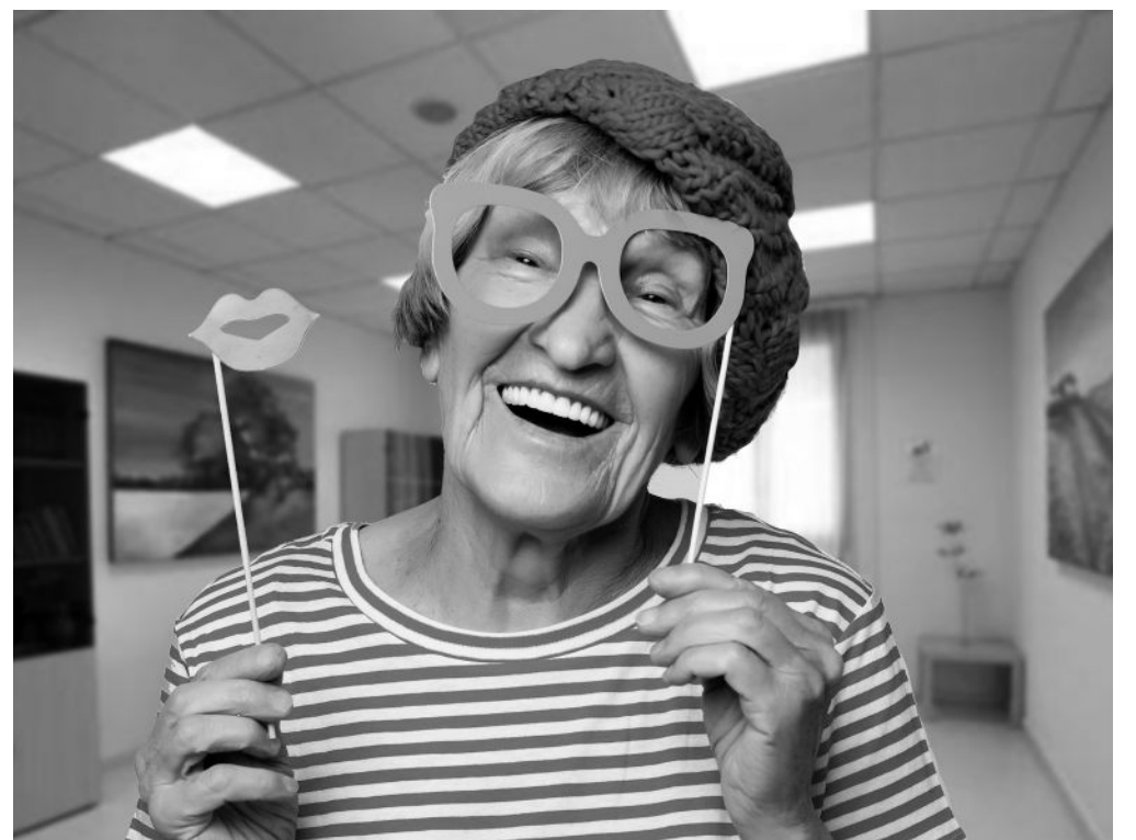
Nuestros mayores disfrutaban los carnavales con mucha alegría.

Como cada año en Carnaval, Amavir Pozuelo se rinde a la fiesta de disfraces en el que previamente nuestros residentes preparan todos los detalles con mucho cariño y alegría. Días previos a la celebración los usuarios realizan los preparativos de las distintas actividades en la sala animación. Nuestros mayores disfrutaban mucho trabajando en caracterizar la ropa, pero se lo pasan mejor cuando llega el día de celebración donde se disfrazan y participan en un concurso al mejor disfraz. El día del carnaval se acompaña con música de la época y un pisolabis que lo hacen memorable. La fiesta finaliza con nuestro ya famoso Entierro de la Sardina donde los usuarios se implican mucho llorándola.