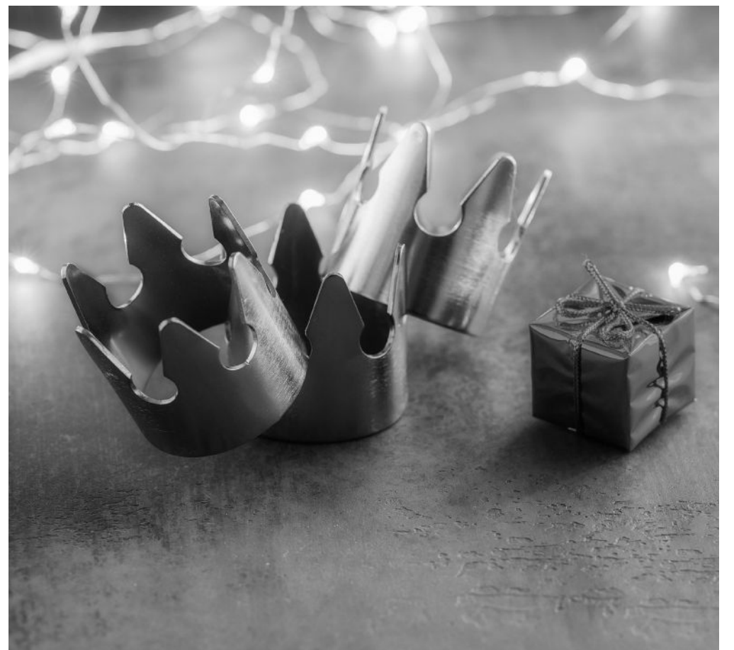
A la espera de la llegada de los Reyes Magos.

Como cada año en nuestra residencia, tendremos la visita ineludible de Sus Majestades los Reyes Magos de Oriente y sus respectivos pajes. Acudirán cargados de regalos para despertar sonrisas en los residentes y trabajadores del centro. Todo ello acompañado de música y diversión. Celebraremos el paso de otro año más y daremos comienzo a uno muy especial, que empieza con nuestros usuarios vacunados con la tercera dosis y ganas de volver a la normalidad tras este tiempo. Con el paso de estos Reyes Magos daremos por finalizada la Navidad, con esperanzas renovadas e ilusión por afrontar este 2022 que, sin duda, nos traerá grandes momentos que vivir y disfrutar. No dudéis que tendremos grandes actuaciones, excursiones, nuevas actividades y talleres durante este nuevo año. Es un placer para nosotros poder compartir con todos ustedes un año más haciéndoles partícipe de todos y cada uno de los momentos tan especiales, emotivos y divertidos que vivimos en esta gran familia como es Amavir. Gracias por acompañarnos en este nuevo año.