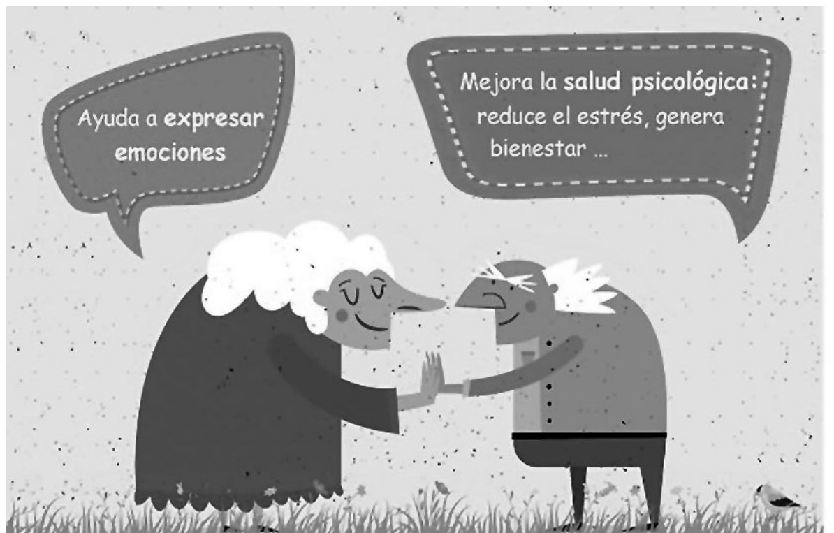
Nuevos momentos de debate.

Los lunes por la tarde nuestra sala se ha vuelto a convertir en un espacio de debate sano, donde nos sentamos en círculo para conversar sobre el tema elegido. Es un momento que ha tenido muy buena aceptación por parte de los mayores del centro, en el cual poco a poco se han ido animando a expresar lo que piensan con total libertad, pero siempre desde el respeto. Se debatirán temas como la juventud de antes en comparación con la actual, el uso de las nuevas tecnologías frente a las relaciones sociales, los trabajos desarrollados frente a las pensiones, la juventud y la etapa de envejecimiento, gastar el dinero y ahorrar, entre otros. El objetivo de este taller es favorecer la libertad de opinión de los usuarios y el respeto hacia las ideas de los demás, mejorar la capacidad de crítica, la socialización del grupo y sus habilidades sociales. Vamos por buen camino, sin lugar a dudas.