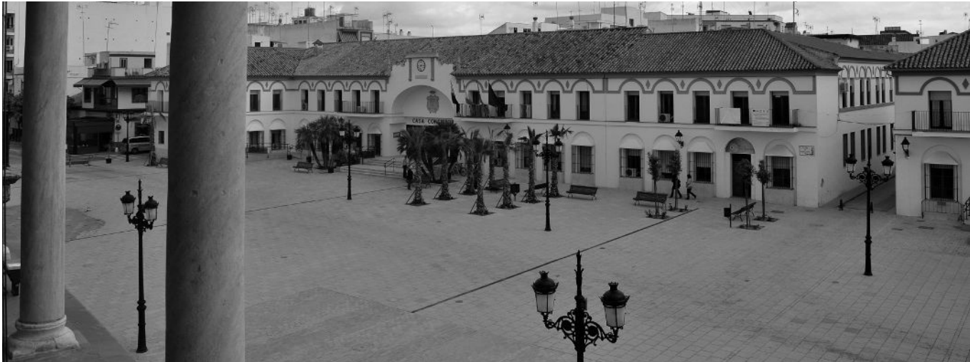
El pueblo cordobés de Encarnación.