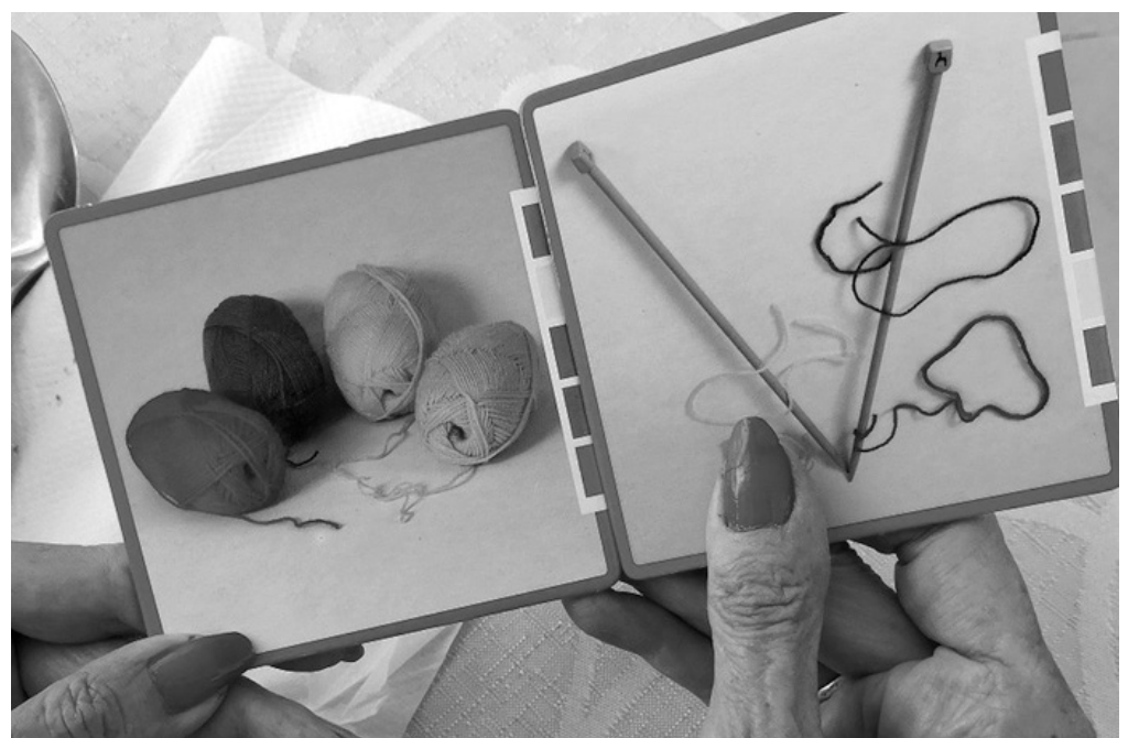
Taller de punto.

La terapia de reminiscencia es muy utilizada con personas mayores, con y sin deterioro cognitivo. El objetivo de esta es la evocación de recuerdos de la historia personal a través de los cuales se consigue la estimulación cognitiva, funcional y social. Para llevarla a cabo se puede poner música de la época, anuncios que veían de pequeños, fotos familiares u objetos que pudiesen tener en casa. También se puede realizar de manera más guiada preguntando sobre un tema en concreto, por ejemplo: “¿a qué jugabais de pequeños?” Este tipo de técnica se realiza normalmente desde el Departamento de Psicología o de Terapia Ocupacional.