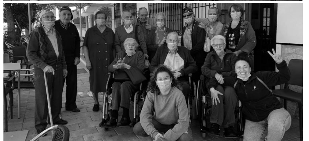
Retomamos viejas costumbres.