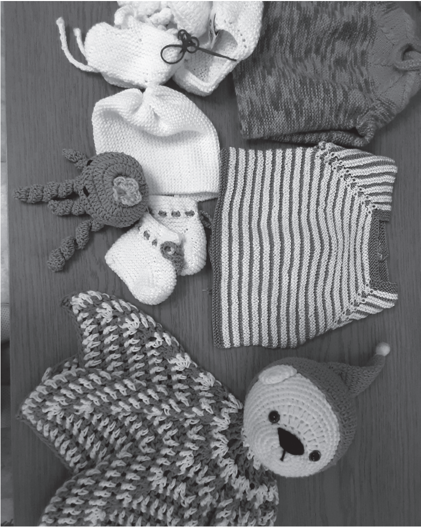
Modelos e ideas para hacer en casa.

los con unas onzas de chocolate y así de fácil tendrás un helado delicioso de lo más natural. -Tan buen placer para el paladar, podemos acompañarlo con otro fantástico placer auditivo, así que elige algunas canciones positivas que te motiven para disfrutar a tope. ¿Empiezas con tu lista? -Haz de tu salón una pista de baile y a darlo todo moviendo el esqueleto, no olvides que tu corazón, tu cuerpo y tu cerebro lo agradecerán porque, además, es divertidísimo. -Por último, una sesión de relajación con una respiración lenta que favorezca tu estado de ánimo. Piensa sobre el destino de tu próximo viaje, empieza a imaginar en positivo. El mundo te espera.