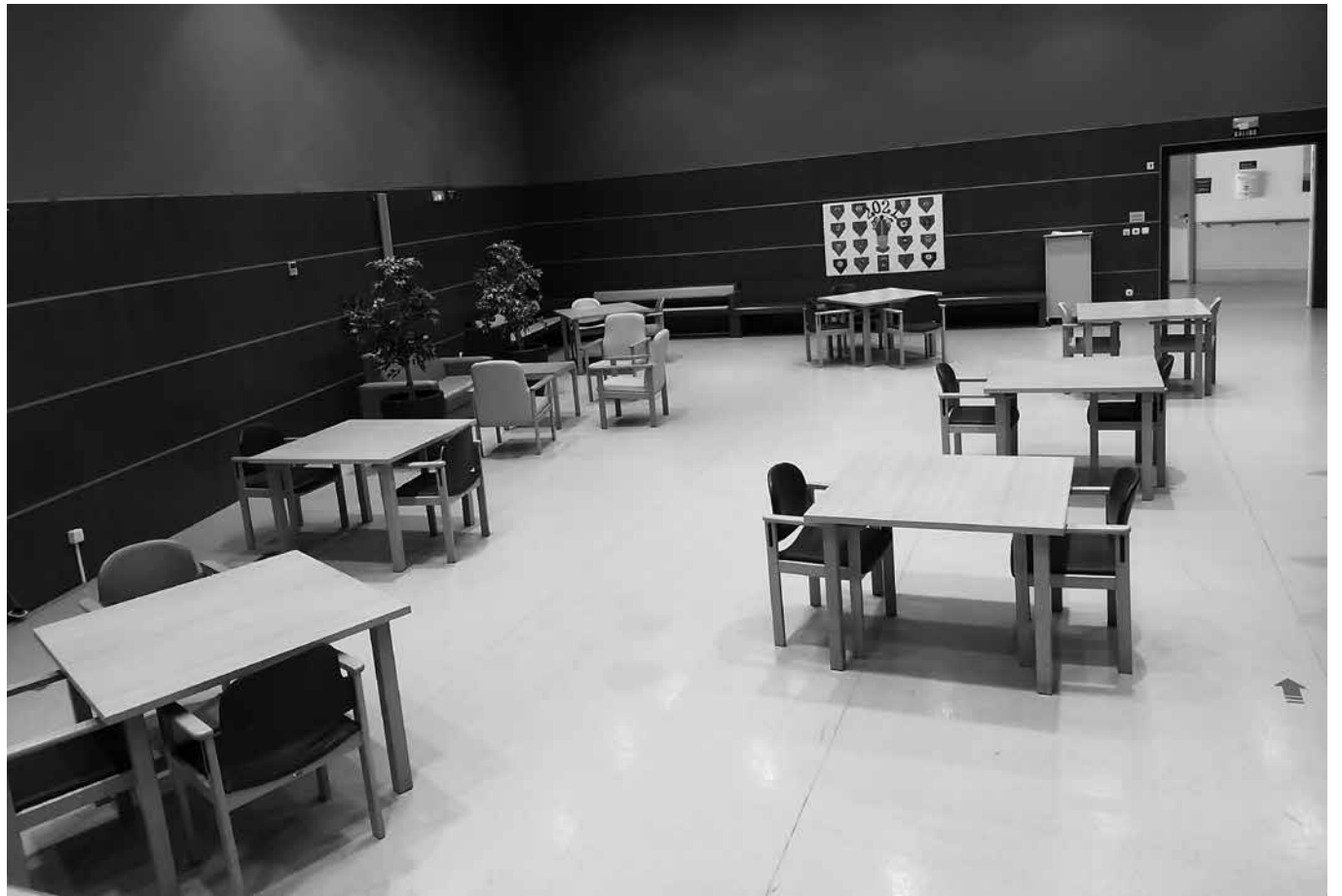
Salas interiores para disfrutar con nuestros familiares.

Gracias a la mejora notable en la situación epidemiológica y a la nueva normativa, hemos podido reanudar todos los talleres e incluir algunos nuevos. Asimismo, queremos ofrecer en breve actividades y encuentros para las familias de nuestros residentes. La puesta en marcha de este servicio se comunicará a cada una de ellas. Por otro lado, el centro ha abierto sus puertas a las familias habilitando y adecuando salas interiores para sus encuentros. Aunque estas han estado presentes en todo momento, era necesario seguir avanzando hacia la normalidad. Hemos podido hacer realidad sus demandas ofreciéndoles la posibilidad de reunión en espacios interiores y confortables para que pudiesen disfrutar con los suyos la llegada del otoño invierno.