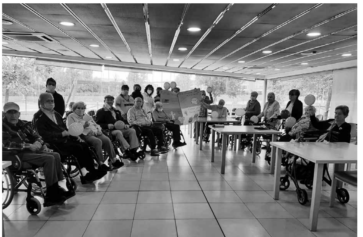
Los residentes de Amavir Mutilva en la actividad con motivo del Día Mundial de Alzheimer.

Como cada año, el 21 de septiembre celebramos en Amavir Mutilva el Día Mundial del Alzheimer con diferentes actividades en el centro. Este año contamos con la presencia de unos chicos y chicas de la Asociación de Síndrome de Down que vienen cada 15 días al centro para hacer actividades conjuntas. Ya es el segundo año que repetimos y es una experiencia muy positiva para todos. Hicimos un mural entre todos y nos quedó claro que es muy importante seguir diariamente una alimentación equilibrada, realizar ejercicio físico, ejercitar nuestro cerebro, mantenernos socialmente activos y pasar el mayor tiempo posible con nuestros seres queridos.