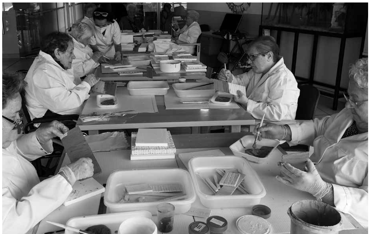
Nuestros residentes pintando las piezas de porexpán con tierras.

El origen de representar el nacimiento poniendo un belén se lo debemos a San Francisco de Asís, que inició la tradición en la Navidad de 1223. La costumbre comenzó en Italia, después se exportó a España y, posteriormente, al resto de los países de Europa y América Latina. San Francisco de Asís es el Patrono de los Belenistas de España. El Belén se llama también Nacimiento, Pesebre o Portal. Y, para no faltar a la tradición, en la residencia de Mutilva este año hemos vuelto a reanudar el cursillo de belenismo de la mano de Carlos, hijo de una residente y miembro de la Asociación de Belenistas de Pamplona. Estamos realizando dos proyectos. Por un lado, el belén del centro; y, por otro, un belén individual para cada uno de los participantes. En el curso estamos aprendiendo las técnicas básicas de construcción de belenes con porexpán y, sobre todo, compartiendo momentos inolvidables llenos de risas.