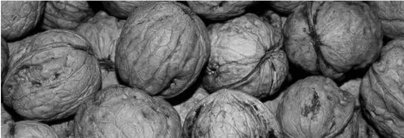
Nueces como las que lanzan desde los balcones del Ayuntamiento en Fustiñana.