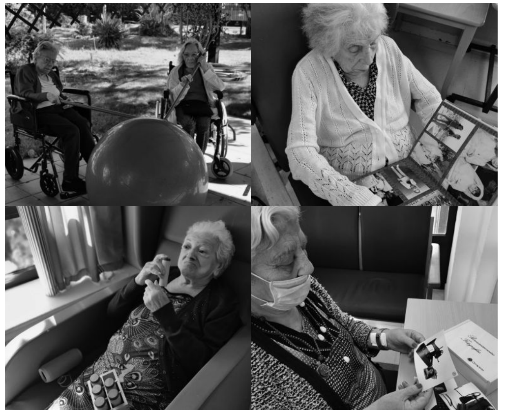
Todo un placer verlos disfrutar así.

Como cada año, en el centro se celebra el Día Mundial del Alzheimer. En esta ocasión decidimos realizar diferentes actividades adaptadas a las características de las unidades de convivencia. Pasamos un día repleto de acción mediante técnicas que nos ayudan a trabajar en el cuidado de las personas mayores a la vez que sensibilizamos y damos visibilidad a esta enfermedad. En “Rosas” realizamos un bingo musical, fomentando el ocio y la participación social. En “Olivos” encaminamos la intervención hacia una sesión multisensorial. En la unidad de convivencia de “Olmos” proyectamos una sesión de trabajo donde el foco estaba en la técnica de la reminiscencia, que favorece la evocación de recuerdos del pasado. En “Jazmines”, durante la tarde, nos decantamos por una jornada de psicomotricidad en el jardín, aprovechando el buen tiempo que aún nos acompañaba. En la unidad de “Paseo del Mar” la celebración de este día fue a través de la “musicoterapia” como técnica encaminada a la evocación de recuerdos a través de la música.