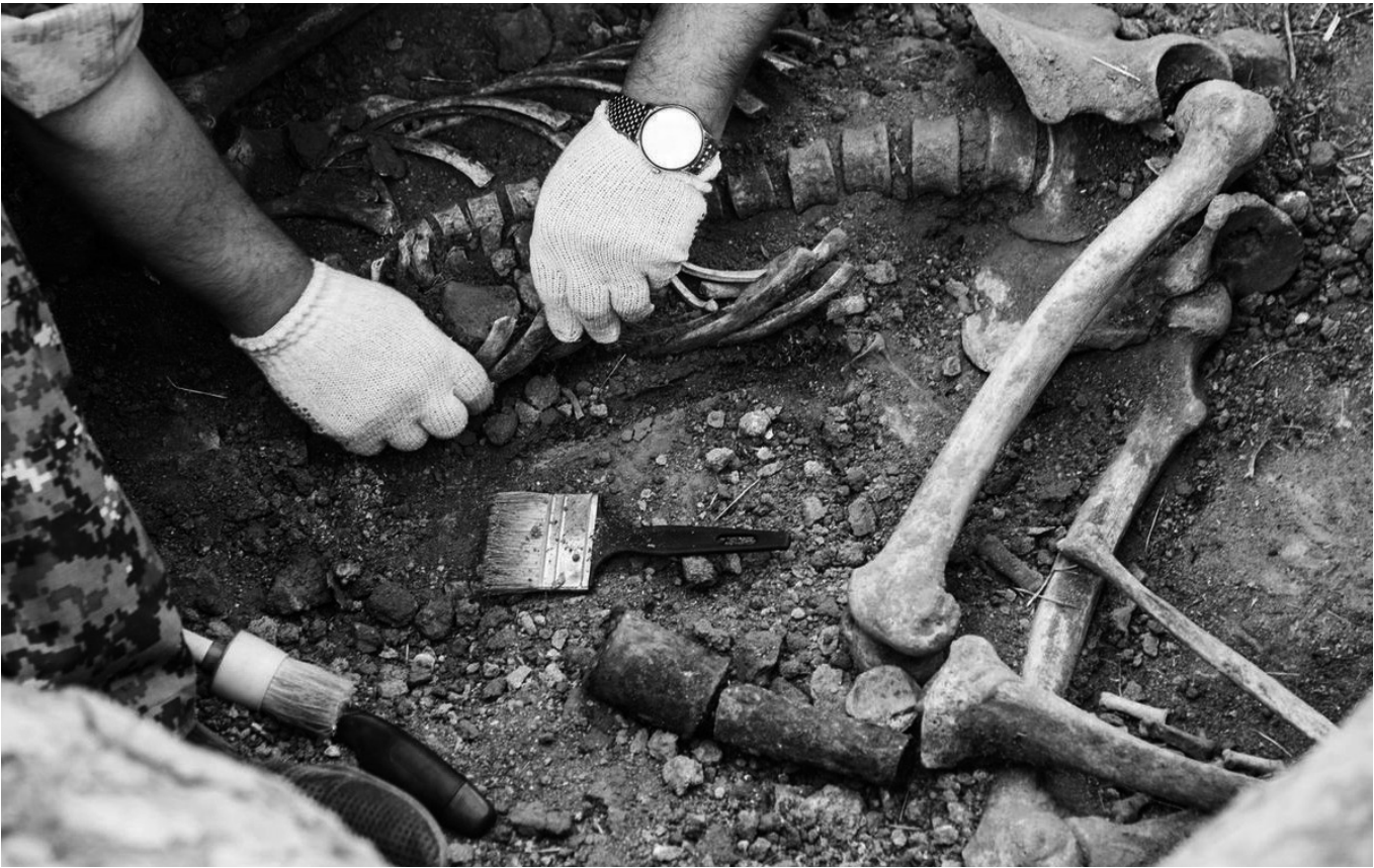
El yacimiento de Atapuerca.