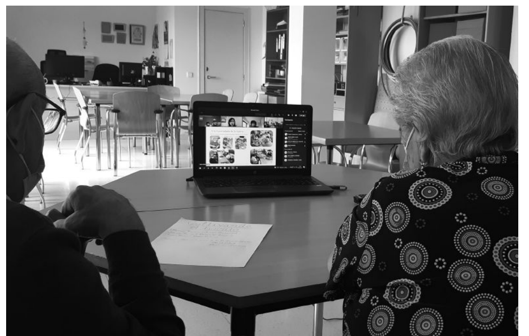
Juntos elegimos al ganador.

Desde la Dirección General de Atención al Mayor y a la Dependencia nos ofrecieron formar parte del jurado para el concurso “Cultivando el Huerto” 2021, después de que resultásemos premiados en la anterior edición, algo de lo que nos sentimos muy orgullosos. Fue toda una responsabilidad la tarea encomendada, por ello, desde el centro organizamos una sesión de visualización de los huertos concursantes para elegir cual sería nuestra apuesta ganadora, así como el segundo, tercer puesto y menciones especiales. El 30 de septiembre, participamos en una sesión por videoconferencia con el resto de centros que conformaban el jurado y juntos tomamos las decisiones finales.