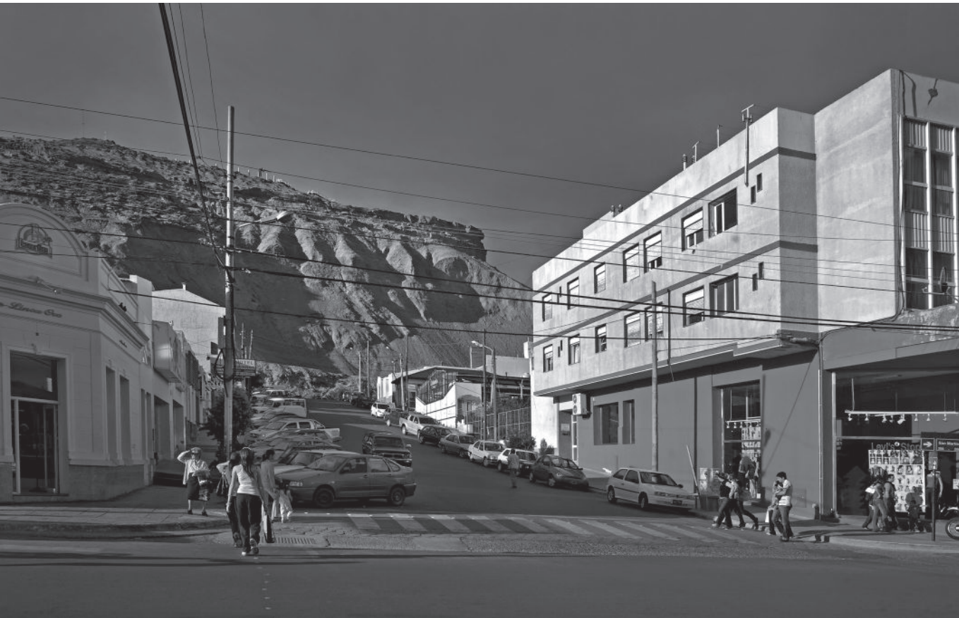
Comodoro desde las alturas.