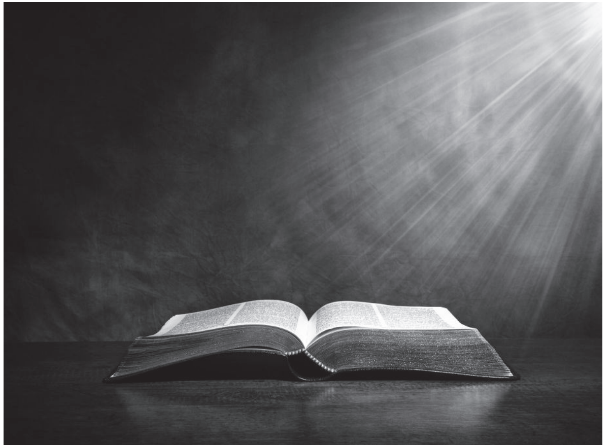
La Biblia, objeto referente de la eucaristía.