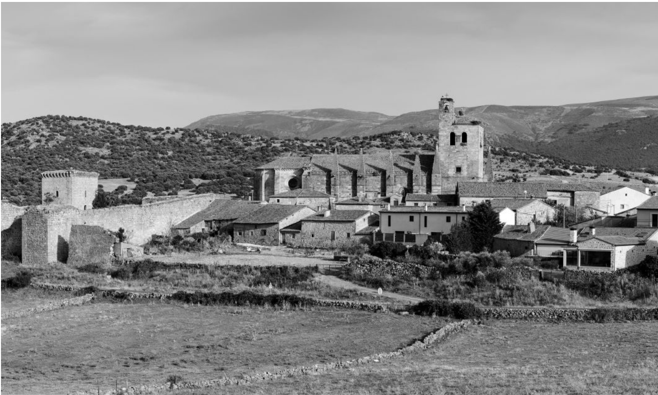
Foto panorámica de Bonilla de la Sierra.