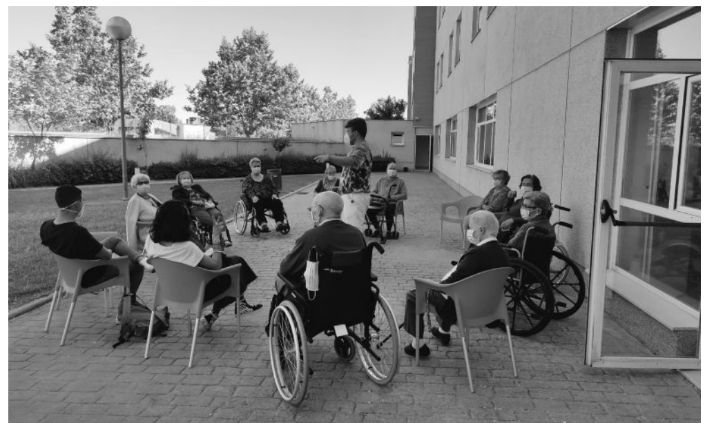
El programa Duplos en acción.

Este curso académico volvemos a contar con los alumnos de la universidad Carlos III, que han retomado las actividades con los residentes en el marco del programa Duplos. Desde octubre hasta el verano de 2022, grupos reducidos de estudiantes llevarán a cabo dinámicas con los mayores con el fin de estimular sus capacidades, aprender cosas nuevas, crear lazos, mejorar el estado de ánimo, etc. Para los estudiantes también supone un aprendizaje a todos los niveles, pero sobre todo se dan cuenta de que cada persona mayor tiene sus inquietudes, valores, gustos y preferencias, como cualquier persona de otro grupo de edad. No son todos iguales.