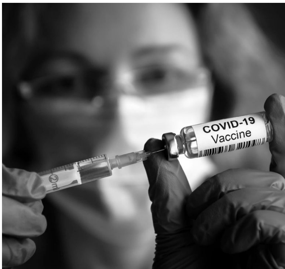
Vacuna frente a la COVID-19.

Diferentes estudios demuestran que la tercera dosis de la vacuna frente a la COVID-19 aumenta la capacidad de producción de anticuerpos. Con este nuevo gran paso, podemos sentirnos un poquito más seguros y poco a poco ir creando nuestra nueva normalidad. Los residentes asumieron esta dosis como un chute de energía, y, aunque con algunos efectos secundarios, vieron esta nueva vacuna como algo positivo para su bienestar. De esta manera, siguen disfrutando de las visitas de sus familias y de actividades que, gracias a todo el esfuerzo realizado, podemos ir retomando en nuestro centro. Estamos muy contentos porque algunos residentes reticentes se han animado a ponerse la primera dosis. Esto supone que tenemos vacunados al 100 % de nuestros residentes. Aun así, este virus seguirá con nosotros un tiempo, por ello, y para que su casa sea segura para nuestros mayores, seguimos teniendo mucho cuidado y siguiendo las pautas que nos indican.