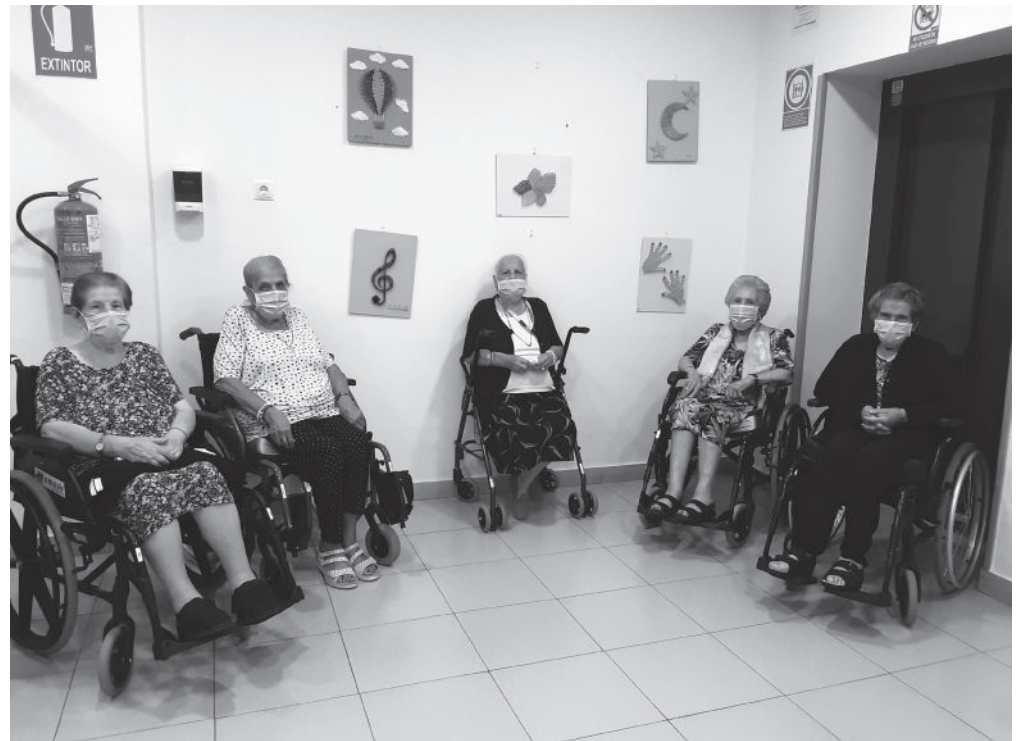
Imagen de la inauguración de la exposición.

El hilorama, también conocido como “arte con hilos tensados”, es una técnica fácil y divertida que consiste en decorar cuadros con hilos de colores enrollados alrededor de clavos. Esta práctica ofrece la posibilidad de plasmar casi cualquier diseño que imaginemos, creando así un cuadro personalizado y original que podemos utilizar para adornar cualquier rincón o, incluso, para regalar. Además, durante el desarrollo de esta actividad se favorece la relajación, la concentración y la creatividad. Dada la novedad de esta manualidad y sus múltiples beneficios decidimos lanzarnos a la aventura y desarrollar un taller enfocado como actividad preventiva de la enfermedad de Alzheimer, ya que este día se celebró el pasado 21 de septiembre. Con todos los materiales preparados: base de madera, pintura, hilos de colores y clavos solo nos quedaba ponernos “manos a la obra”. Una idea que a nuestros residentes y usuarios de centro de día no asustó, sino todo lo contrario, se mostraron ilusionados ante esta novedad y pusieron muchas ganas y esfuerzo demostrando sus grandes habilidades manuales. El resultado