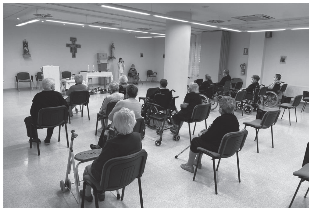
Momentos previos a la celebración de la primera misa.