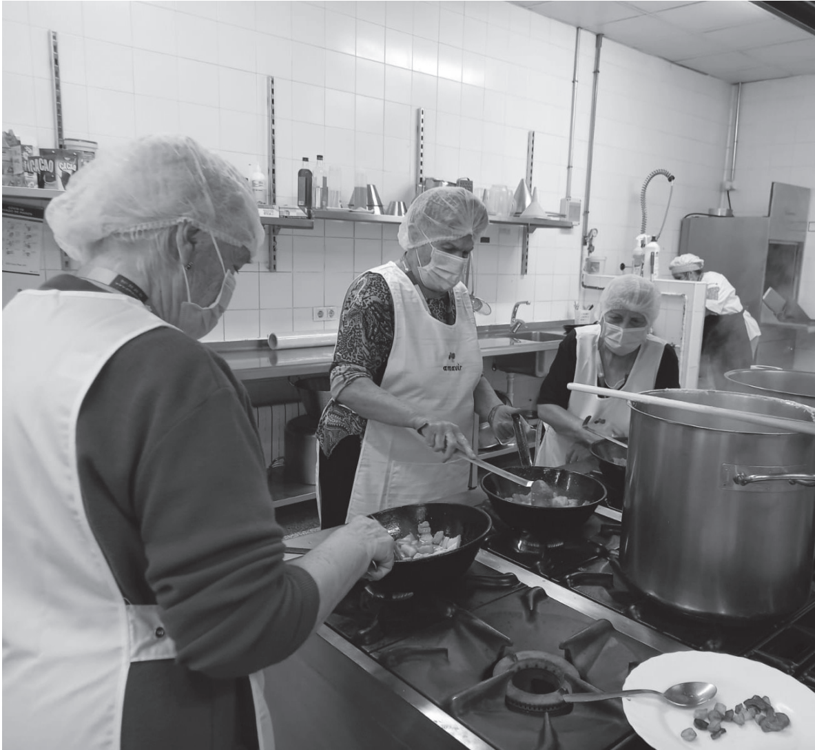
Imagen de nuestras participantes en la cocina.

Como es tradicional en nuestra ciudad, el 21 de septiembre celebramos la festividad de San Mateo y, con él, el tradicional concurso de gachas. Una de las actividades extraordinarias que más alegra a nuestros mayores, pues son ellos mismos quienes elaboran este plato típico. Como se ha hecho en años anteriores, buscamos 3 residentes que estén dispuestos a mostrar sus mejores dotes culinarias en lo que a gachas se refiere. Cada uno con su sartén, sus ingredientes y sus “truquitos” entre fogones, preparan una sartén de esta delicia que, posteriormente, es valorada por el jurado y degustada por el resto de residentes. Mientras la comida está en el fuego, el resto de residentes participantes esperan en el salón de actos realizando diferentes actividades. Al finalizar la jornada, se obsequia a los chefs con un regalito por su participación.