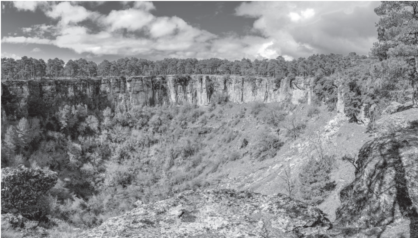
La Torca del Lobo.