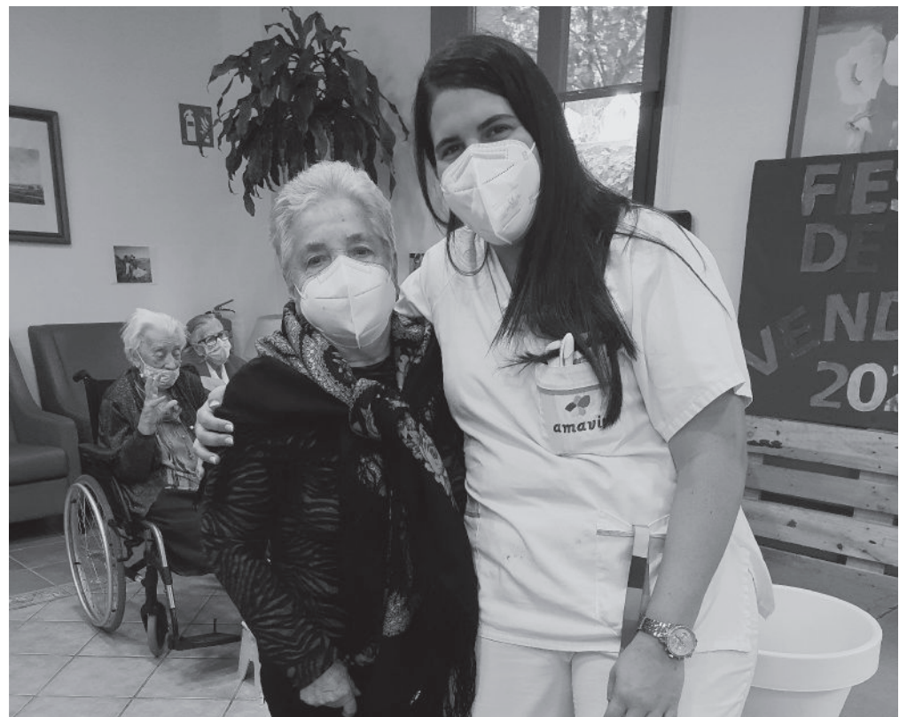
Uno de los momentos de la celebración de nuestra fiesta de la vendimia.

Con las 5 Denominaciones de Origen y las tres Rutas Certificadas que posee Valladolid, desde El Encinar del Rey no podíamos dejar pasar nuestra tradicional fiesta de la vendimia. A mediados de octubre, desarrollamos un programa especial sobre la cosecha con distintas actividades. A través de un taller de viajes visitamos de manera virtual las rutas de las denominaciones de origen de nuestra provincia: Ribera del Duero, Cigales, Rueda, Toro y Tierras de León, donde aprendimos a diferenciar los distintos vinos. Además, los residentes pudieron pisar la uva de manera tradicional en unos lagares un poco “especiales”. Muchos de los participantes demostraron ser grandes expertos en el arte de vendimiar. Tras degustar el dulce mosto, acompañado de queso de la tierra, pasamos a la parte más festiva de esta completa jornada donde cantamos, bailamos y disfrutamos de la actuación del grupo de variedades “La Bien Pagá”.