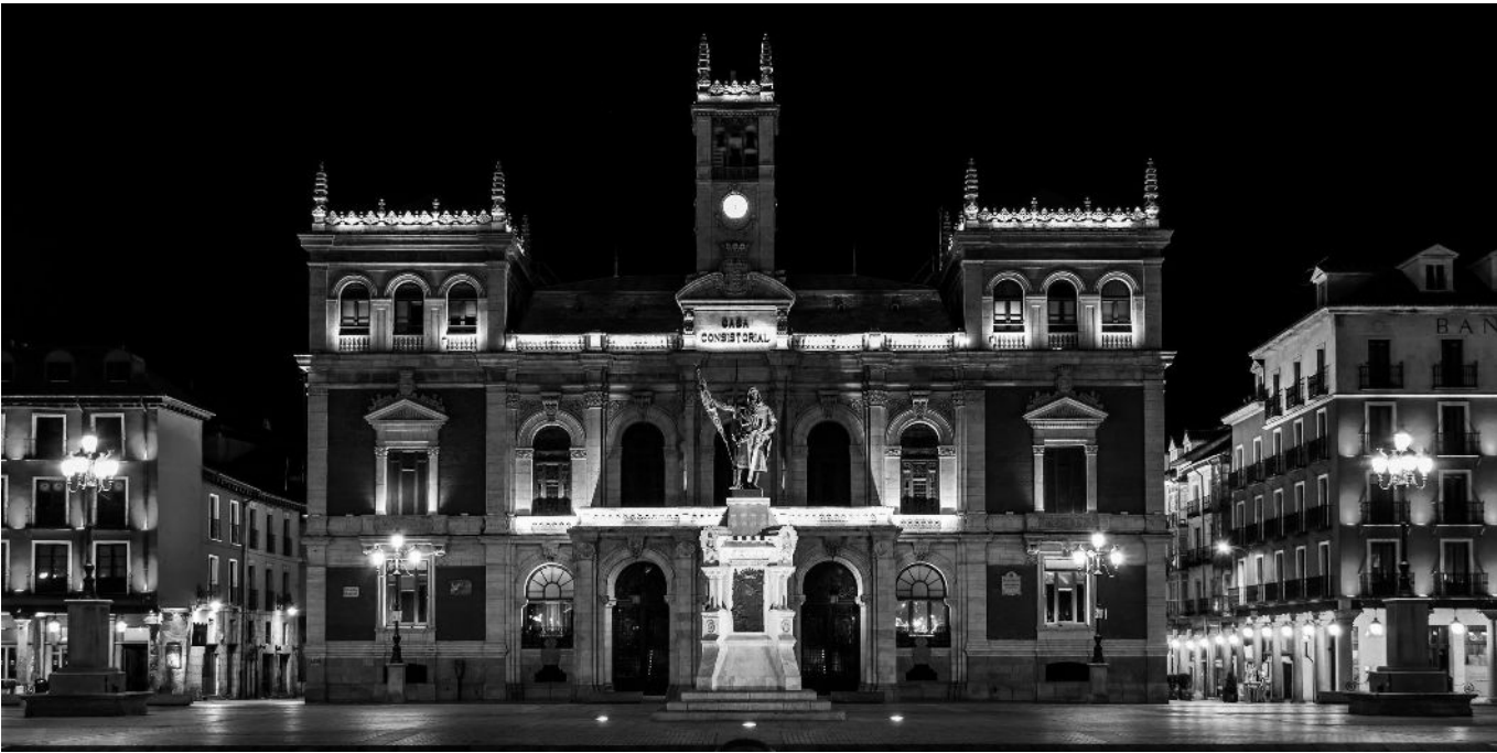
La Plaza Mayor de Valladolid de noche.