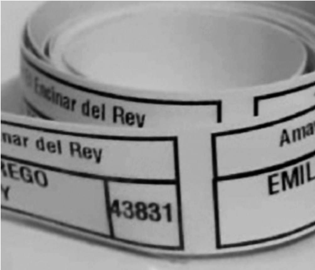
Etiquetas de la casa.

Desde el comienzo de la estancia en la residencia insistimos en la importancia de que toda la ropa esté perfectamente marcada con el nombre y apellidos del residente, así evitamos pérdidas, ya que en esta casa somos muchos, y en la lavandería cada día se trabaja con cientos de prendas. Una ropa no etiquetada es una prenda perdida con el consiguiente disgusto y malestar del residente y las familias. Lo mismo ocurre con otros objetos como bastones, andadores, entre otros, que también deben llevar una pegatina identificativa. Cada prenda u objeto debe ir con una etiqueta en la que tenga el nombre y apellido debidamente cosida o pegada. De esta manera, tras su lavado y planchado, se coloca en una caja personalizada y se devuelve al armario correspondiente. Para más facilidades, la residencia cuenta con un servicio de etiquetado termosellado que facilita esta labor a las familias.