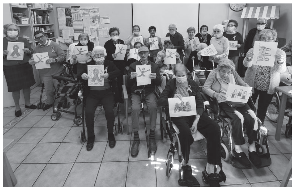
Grabación del vídeo.

El 19 de octubre se celebró el Día Internacional del Cáncer de Mama, una iniciativa de la Organización Mundial de la Salud en la que también quisimos formar parte. Los residentes de El Encinar del Rey son conscientes de la importancia de la detección precoz del cáncer de mama, por lo que realizaron un precioso vídeo que hemos colgado en redes sociales. Han ensayado durante varias sesiones de terapia ocupacional con mucha ilusión para dar su apoyo a las mujeres que luchan contra la enfermedad, pero también a las organizaciones de ayuda y, por supuesto, a los investigadores. Fue todo un reto y mucho trabajo para conseguir que la coordinación de todos los participantes fuese perfecta. El resultado mereció la pena.