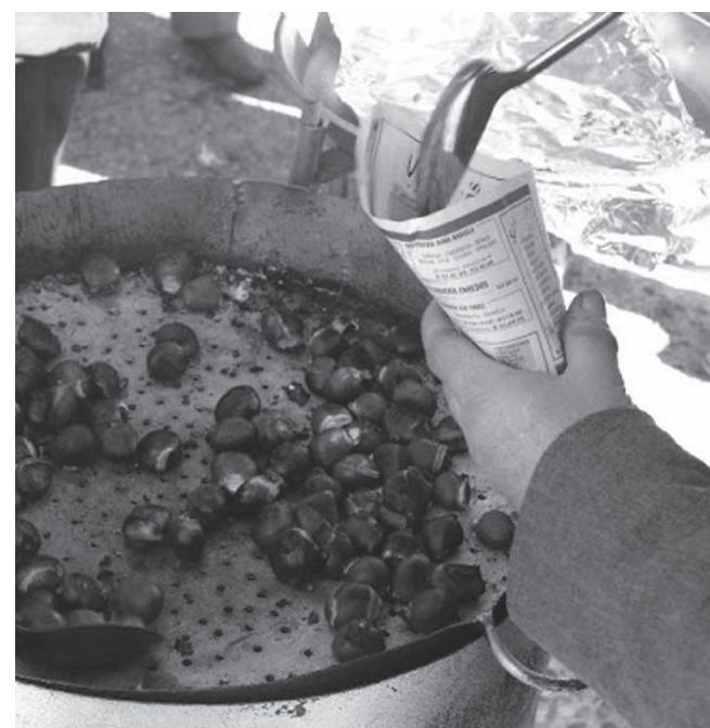
Un puesto de castañas asadas.

ción de asar castañas para disfrutar del otoño está muy arraigada. En las plazas de muchos pueblos se instalan puestos de venta ambulantes de estos frutos. Además, en Tomelloso existe la tradición del “puñado”, se trata de la compra de frutos secos como castañas, nueces o higos en los puestos del mercadillo que se ponían en la calle Campo y en la Plaza del Mercado de Abastos. Una tradición que se remonta a varias generaciones.