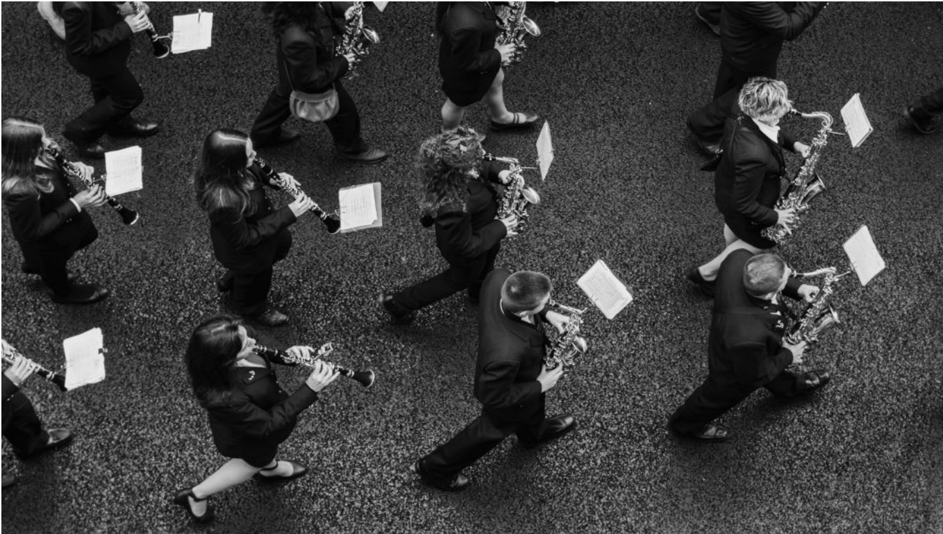
La banda de música Santa Cecilia.

La música es un lenguaje universal que nos alegra, nos conmueve y nos transporta a los recuerdos más importantes de nuestra vida. La banda de música Santa Cecilia está ligada a la historia familiar de Tomelloso. Los actos y fiestas más importantes de la ciudad siempre se han celebrado acompañados de la música de estos profesionales. Muchos de sus miembros son hijos, nietos y bisnietos de aquellos músicos que la iniciaron en 1917. Ellos han sido testigos y protagonistas de la historia reciente