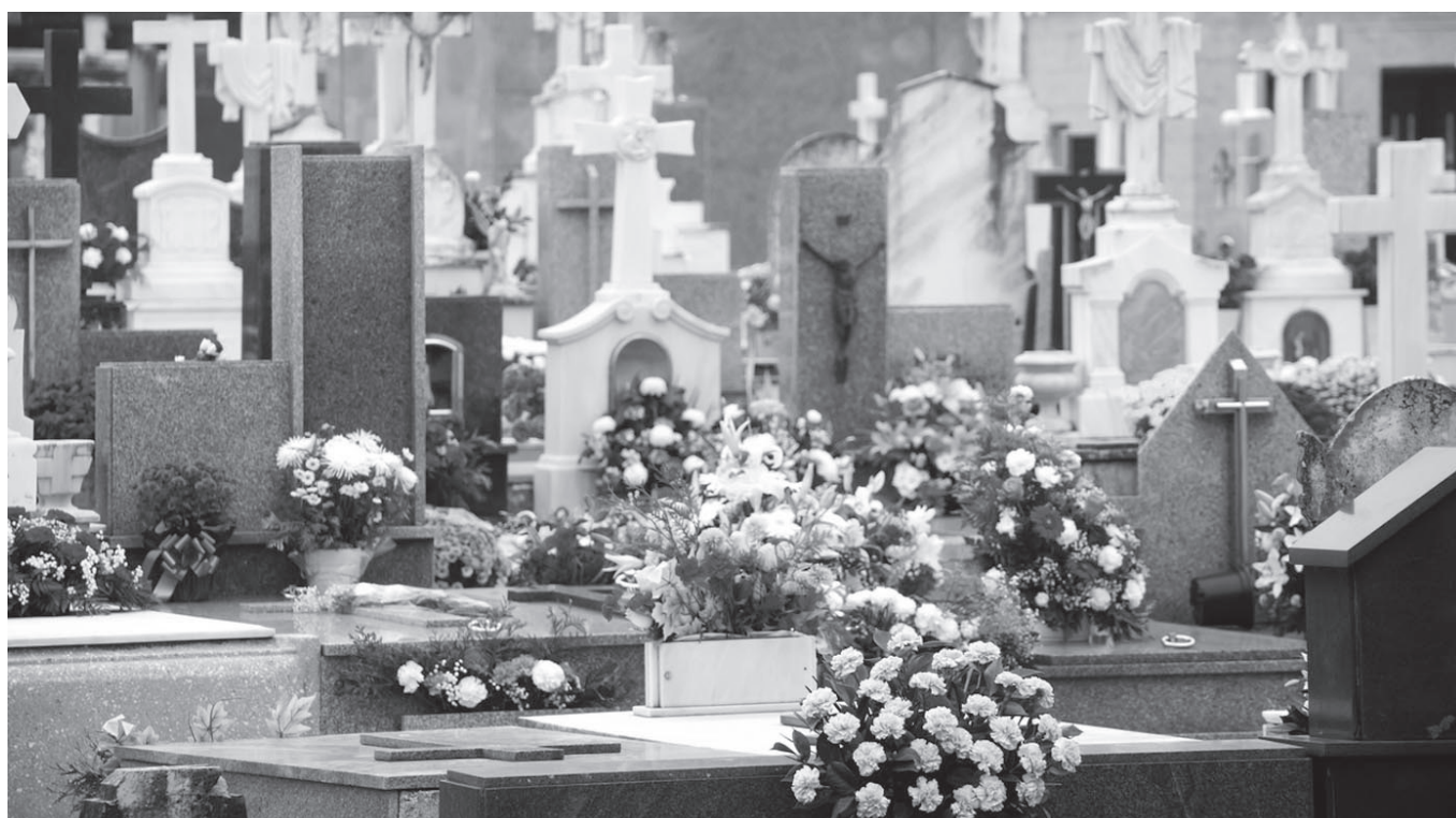
Un cementerio en el Día de Todos los Santos.

El 1 de noviembre se celebra el Día de Todos los Santos. Se trata de una fiesta religiosa. Sus orígenes se remontan a cuando el Papa Gregorio IV ordenó en el año 835 a todos los cristianos a que honrasen a los santos. Tras dicha festividad, el 2 de noviembre, se invoca a nuestros fieles difuntos ofreciendo de forma particular misas y rezos con velas encendidas para alivio de sus almas. Durante el mes completo se dedican triduos, seisenas, novenarios de rosarios y misas. Antiguamente había un tipo de vela llamada “mariposa”, que se encendía para los difuntos. Se ponían en un tipo de vasija con agua y aceite y lucían hasta ser consumidas. En torno a estos días existen varias tradiciones, principalmente visitar los cementerios y dejar flores a los difuntos. En algunos lugares, la noche de los difuntos se encienden velas en las casas para dar luz a las ánimas, quienes tienen permiso especial de los cielos para visitar a los familiares aún vivos. Además, se comen dulces típicos: huesos de santo, buñuelos y cas-