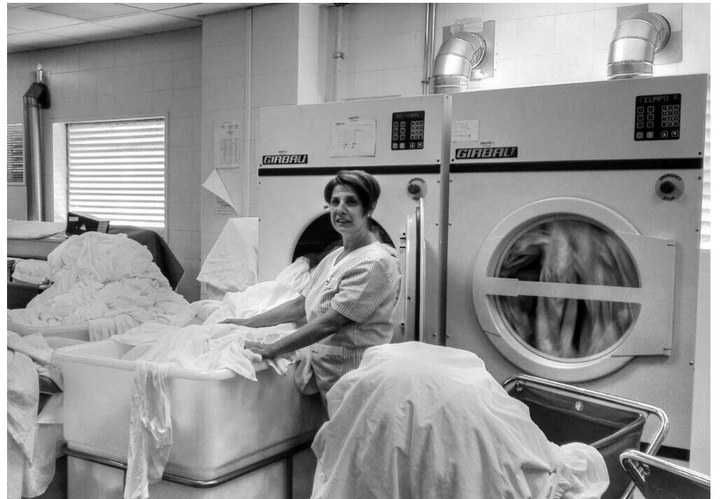
La lavandería del centro.

En el servicio de lavandería, el lavado y planchado es muy importante en nuestra residencia. Este servicio es un apoyo indirecto a la atención del paciente, ya que la ropa puede ser uno de los principales focos de contaminación por el prolongado contacto con los usuarios y trabajadores del centro. El hecho de prestar una labor de estas características dentro del propio centro implica el cumplimiento de unos controles sanitarios muy estrictos para el lavado y desinfección de la ropa. Es por tanto imprescindible cumplir al máximo con las exigencias anteriormente expuestas. La ropa debe ser cómoda y estar higiénicamente limpia. En el centro residencial Don Quijote, disponemos de un Departamento de Lavandería, que consta de dos lavadoras de 40 kg, una de 7 kg, tres secadoras industriales, una calandra y una plancha industrial. A diario, se lavan en la residencia 320 kg de ropa blanca (sábanas, toallas, baberos y almohadas) y 94 kg de ropa de residentes. A estos hay que sumarle todos los extras que suelen surgir como colchas o edredones, cortinas o mantas. La lencería del cen-