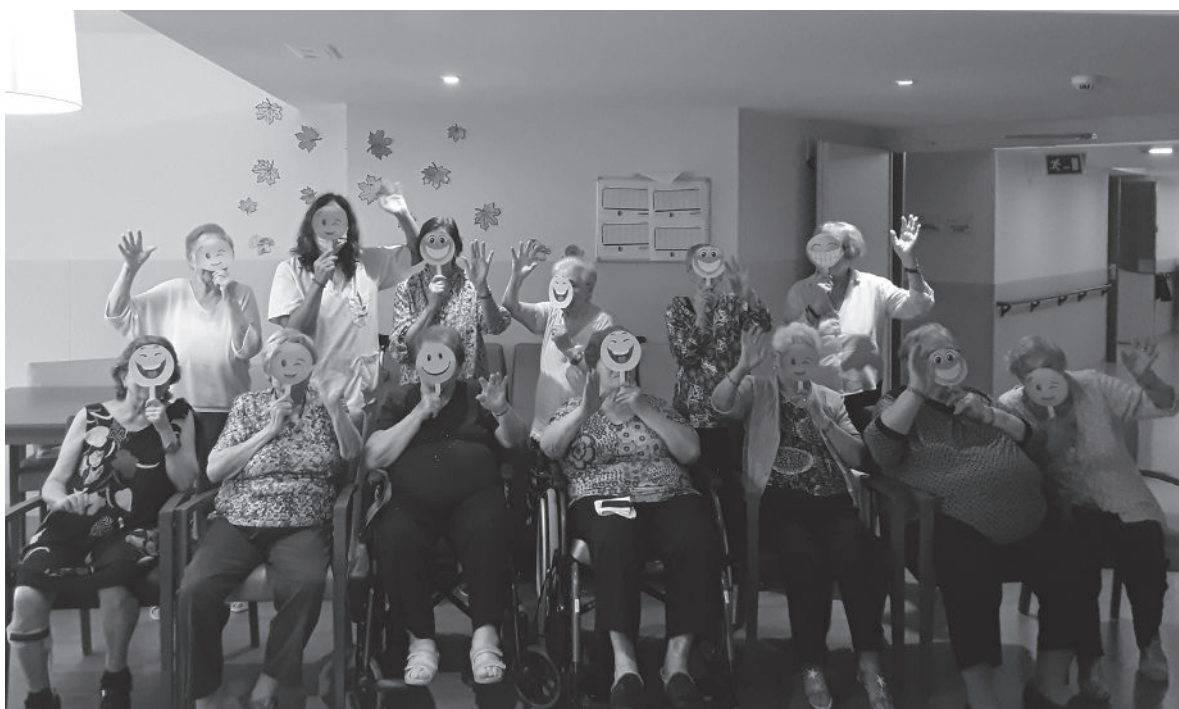
¡A ver si nos reconocéis!