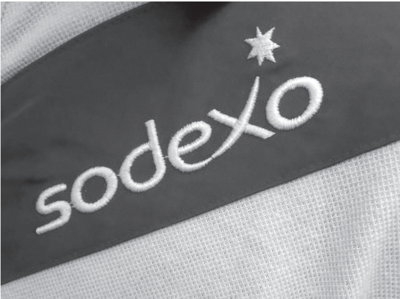
L'empresa que s'encarrega de la nostra cuina.

Un cop més aprofitem aquesta secció per informar del nostre canvi de menú estacional. Com ja sabeu, al nostre centre fem dos canvis de menú: un d'estiu i un d'hivern. SODEXO és l'empresa que s'encarrega de la nostra cuina i aquest serà el segon any que treballarà amb nosaltres. Cada any ens fan una proposta i nosaltres, juntament amb la RHS del centre, l'adaptem als gustos i les necessitats dels nostres residents. La nostra prioritat és que tinguin una alimentació adequada i tan adaptada com sigui possible als seus gustos. Després d'aquest procés, el dietista de SODEXO revisa els nostres canvis i els aprova si compleixen els requisits establerts. Fem menús de cinc setmanes de rotació per evitar que siguin repetitius, i intentem intercalar plats que els agraden i plats que no els agraden tant. En definitiva, intentarem que la nostra cuina s'adeqüi sempre a les necessitats i els gustos dels nostres residents. Esperem, com sempre, que aquest article us hagi ajudat.