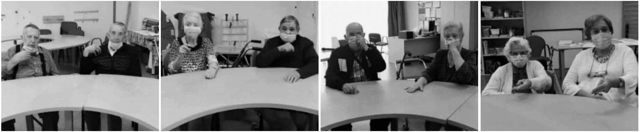
Nuestros residentes aprenden frases en lenguaje de signos.

Homenaje para conmemorar el Día Internacional de las Lenguas de Señas.