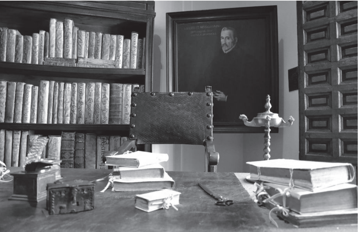
Casa Museo Lope de Vega.