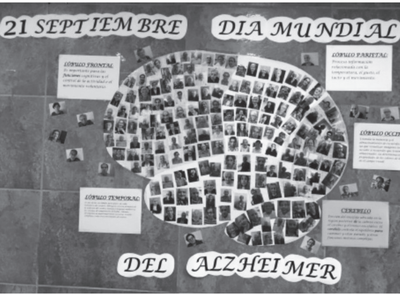
Foto de los murales realizados por nuestros residentes con motivo del Día Mundial del Alzheimer.