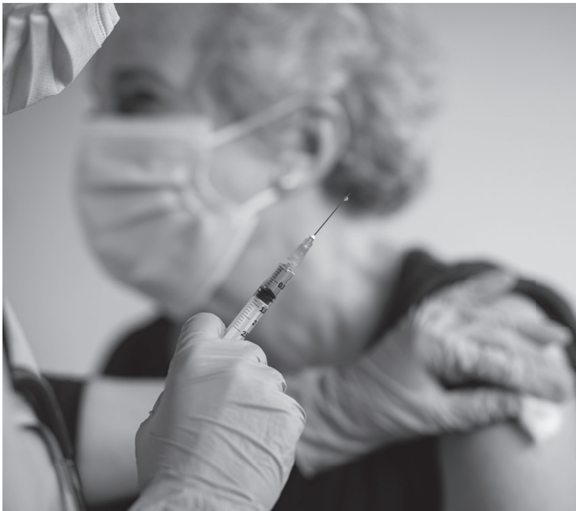
La aplicación de la tercera dosis de la vacuna Pfizer tiene como objetivo hacer que la respuesta inmunitaria sea mayor y perdure en el tiempo.

En el mes de octubre se administró en nuestro centro la tercera dosis de la vacuna de Pfizer, y en este artículo se explicará por qué esto ha sido necesario. Resulta que la evidencia científica actual respecto a la COVID-19, demuestra que una tercera dosis en personas con un sistema inmunitario deprimido o débil, como se da en la gente mayor, ayuda a tener una respuesta inmunitaria más efectiva contra el virus. No nos olvidemos de que, el fin de la vacuna no es no contagiarse del virus, sino que la infección sea más leve e incluso, asintomática. El objetivo de una tercera dosis, en un proceso de vacunación espaciado respecto a las primeras dos dosis, es conseguir una respuesta inmune secundaria, como pasa en otras vacunas como son la difteria, tos ferina, etc. Esto se traduce en que, tras las primeras dosis, a los meses la inmunidad no se llega a reducir a cero, pero sí disminuye la cantidad de anticuerpos, pero al administrar la tercera dosis, la respuesta inmune secundaria es mucho mayor y más duradera. Ofrece mayor protección contra variantes e incluso podría evitar la vacunación anual.