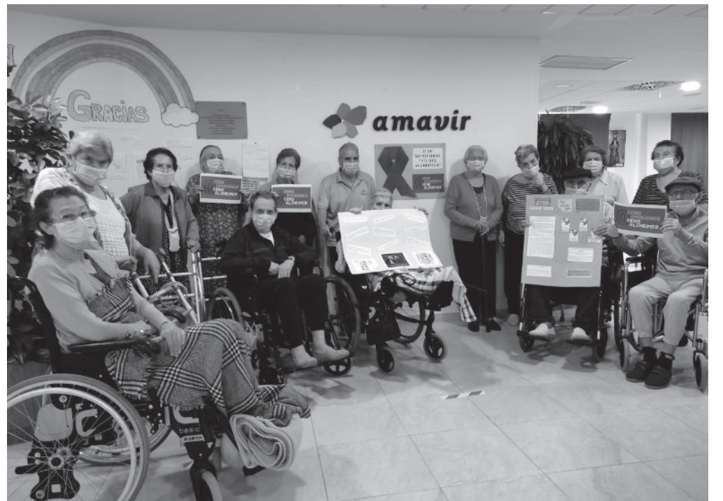
Los residentes tras el cinefórum en homenaje a la enfermedad de Alzheimer.

El pasado 21 de septiembre se celebró el Día Mundial del Alzheimer, fecha en la que multitud de entidades se hacen eco de las consecuencias que esta enfermedad provoca en cerca de las 50 millones de personas que la padecen. Reivindican más investigación como la única vía para mejorar su calidad de vida. Se calcula que entre un 5 y un 8 % de la población mayor de 60 años sufre algún tipo de demencia en algún momento de su vida, siendo el Alzheimer la más común entre ellas. Esta enfermedad provoca diferentes síntomas según cada persona y la etapa en la que se encuentren. Puede generar, entre otras cosas, olvidos, desorientación temporal y espacial, a veces incluso personal, dificultades para la comunicación, así como crear nuevos recuerdos y, poco a poco, impedimento para caminar o para realizar tareas básicas de la vida diaria como el cuidado personal, etc. Como se puede imaginar, es una enfermedad ampliamente extendida en la población mayor, y por eso este día es de especial importancia para nosotros. En Cenicientos hemos querido resaltar la necesidad del ejercicio físico y mental para mejorar la calidad de vida de las personas con Alzheimer, por un lado, y por otro visibilizar