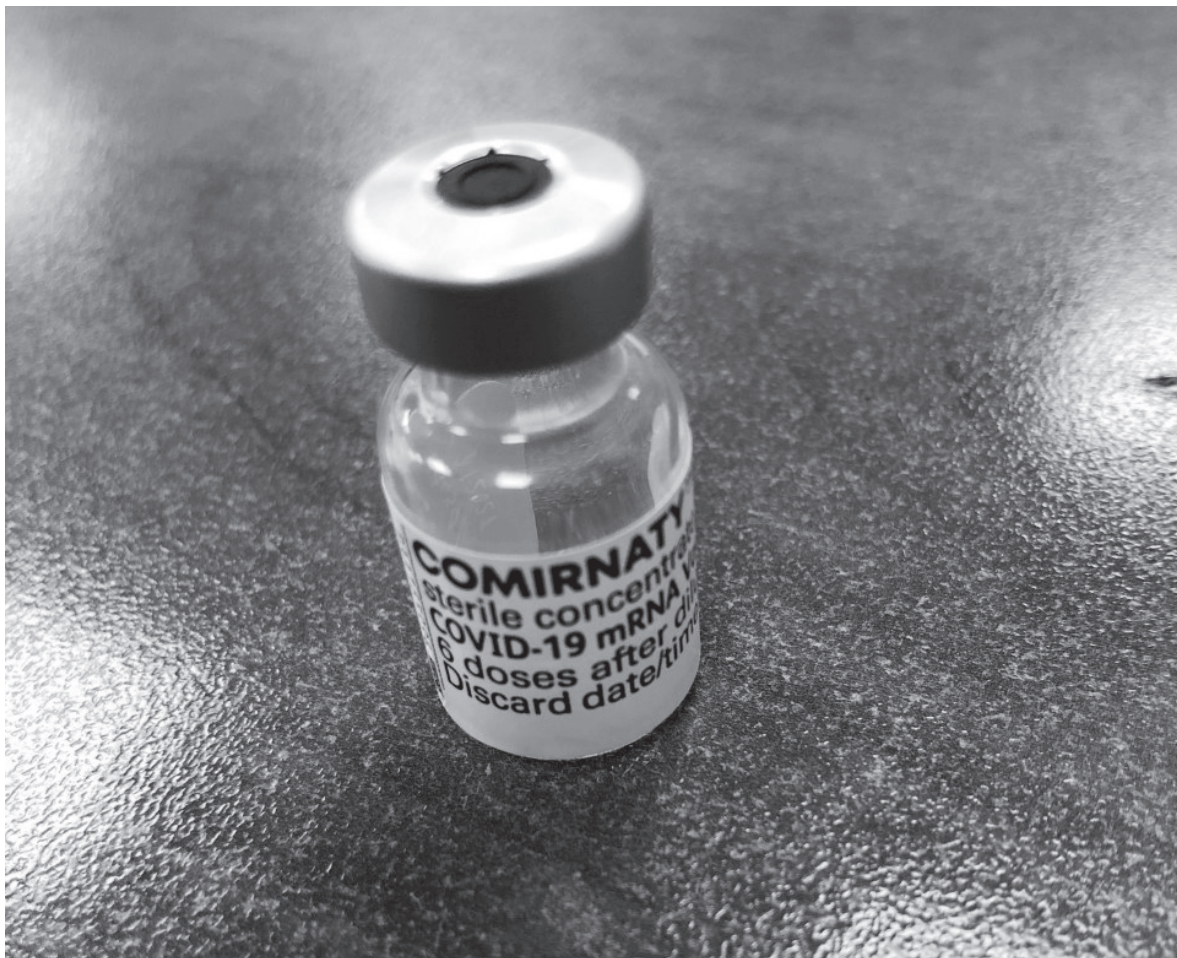
Un vial de la última dosis administrada.

El pasado 7 de octubre, nuestro personal de enfermería, junto a la encargada médica del Grupo Amavir, administraron la tan esperada tercera dosis de la vacuna. En los casos que no hayan pasado seis meses desde la segunda dosis, la recibirán en cuanto se cumpla el plazo. Nuestros residentes la recibieron con la ilusión de poner fin a un año tan duro tras la pandemia y empezar una nueva etapa en la que vayamos recuperando la tan deseada normalidad en los centros, que poco a poco está siendo posible. Hemos preguntado a nuestros mayores qué esperan de esta vacuna, a lo que nos contestan, “poder pasar más tiempo y disfrutar de los familiares como lo hacíamos antes y poder volver a la normalidad”, por lo que están muy contentos de recibir la dosis de refuerzo. También hemos comenzado con la campaña de la vacunación de la gripe como todos los años.