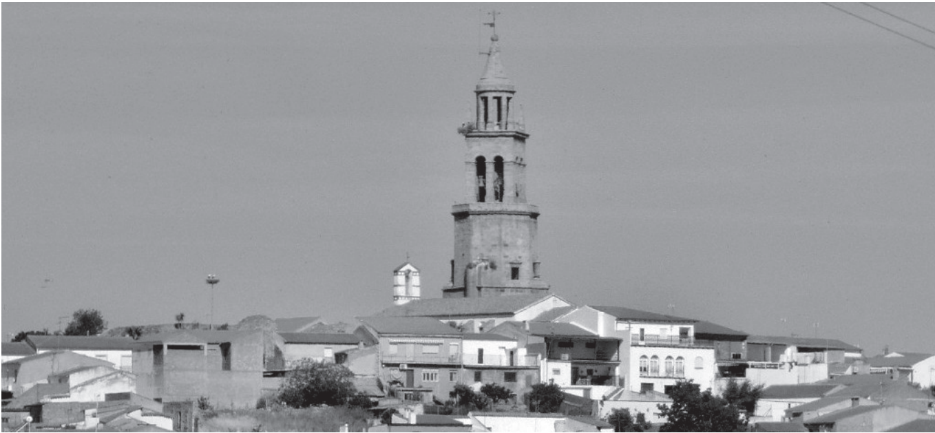
Vista de Pedroche con su característica torre de granito.

Soy Ángel Jordán y nací hace muchos años en un pequeño pueblo de Córdoba llamado Pedroche, que está en la comarca de Los Pedroches. Pasé allí mi infancia, pero éramos muy pobres y había que ayudar en casa, por eso, a los 14 o 15 años me marché a Torrecampo, un pueblo vecino donde empecé a trabajar como camarero en el bar de mis tíos. Estuve trabajando con ellos hasta que me fui a hacer el servicio militar. Al licenciarme volví a mi pueblo natal, pero había muy poco trabajo,