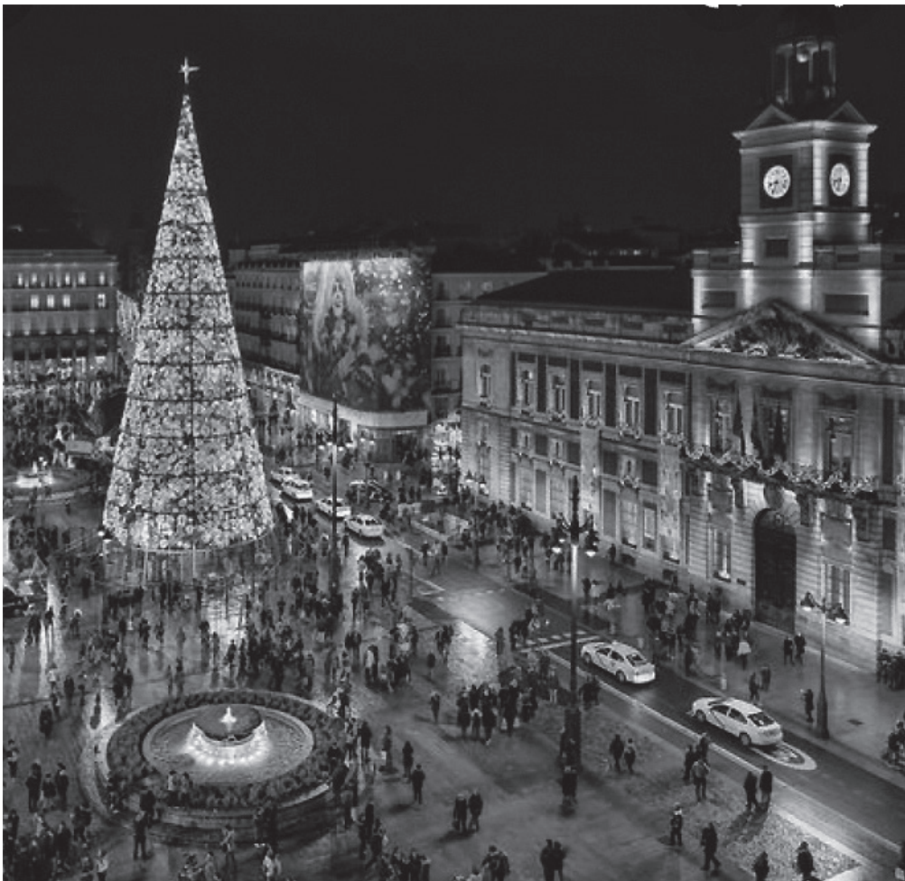
Luces de Navidad en nuestra ciudad.

Las salidas típicas navideñas son las más esperadas del año, no solo porque es una época que para muchos es importante y especial, sino también porque tenemos algunas de las escapadas que más gustan a nuestros residentes. La comida de Navidad en un restaurante es uno de sus eventos preferidos, además de que incluye a muchos de ellos, disfrutan de una comida diferente a lo que están acostumbrados a diario. Otras escapadas que siempre les gustan son cualquier tipo de visita a ver belenes, ver el decorado de Navidad y las calles de Madrid con las luces, ese ambiente que cualquiera podemos disfrutar y que nos saca de nuestra rutina diaria. No obstante, también disfrutamos mucho de las actividades que hacemos dentro de la residencia. Durante el mes de diciembre y, sobre todo, a partir del día 20, siempre hay ocasiones especiales para nuestros residentes. Una de las más señaladas es el encendido del Belén y el árbol. A todos les gusta sentarse alrededor y cantar villancicos. Las plantas siempre están decoradas y eso da un ambiente más alegre entre nuestros residentes y trabajadores. Todas las actividades que hacemos son propias de esta época del año, tales como talleres de repostería, decoración navideña, musicoterapia navideña, y comidas especiales. Por todo este despliegue de eventos, la época navideña es una de las que más disfrutan nuestros residentes.