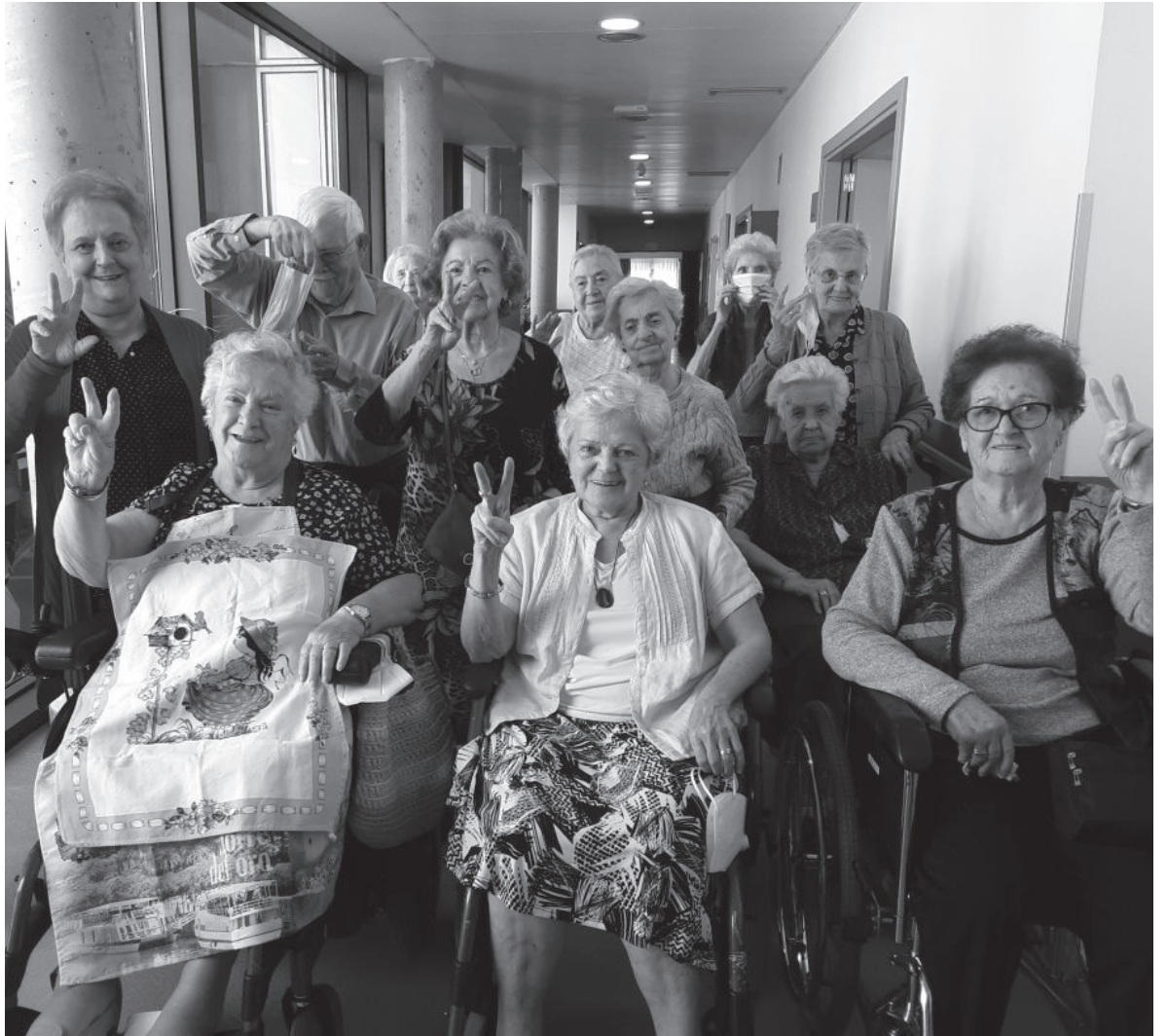
Ellos son los héroes.

Una vez más hemos recibido una lección de vida de nuestros residentes, o, como nos gusta llamarlos, “ABUELOS” con mayúsculas. En esta pandemia ha habido muchos héroes, pero ellos, dada su edad y limitaciones, han sido los verdaderos. Un montón de calificativos los definen: pacientes, optimistas, agradecidos, siempre con palabras de aliento y agradecimiento. Aún siendo confinados una y otra vez, han conseguido que todos siguiéramos adelante, ayudándonos y ayudándose entre sí. Tienen montones de anécdotas entrañables, que les definen como maestros de la sabiduría, la paciencia y del saber vivir cada momento a pesar de la situación, quitándole importancia y con ganas de seguir luchando. Ahora nos queda disfrutar de las próximas fiestas navideñas con salidas, actividades, comidas con las familias y todas las tradiciones de todos los años. Devolverles todo lo que se merecen, cuidarlos, quererlos y conseguir que su vida sea lo más divertida, agradable y tranquila posible.